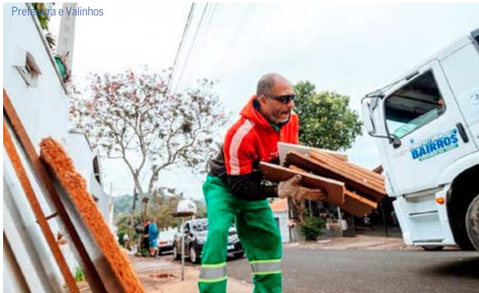
Equipes da operação trabalham na remoção de materiais em Valinhos: ação chega ao Centenário