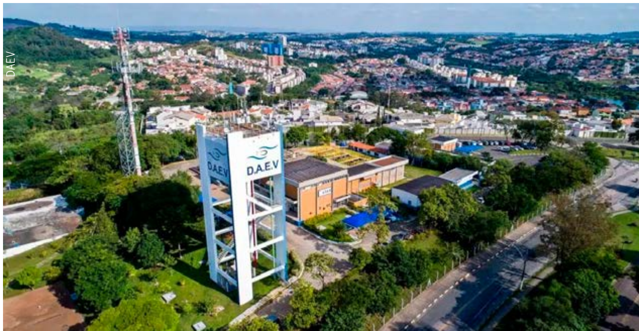
Vista área de instalações do DAEV em Valinhos: anúncio da Prefeitura e contestação da empresa interessada no processo