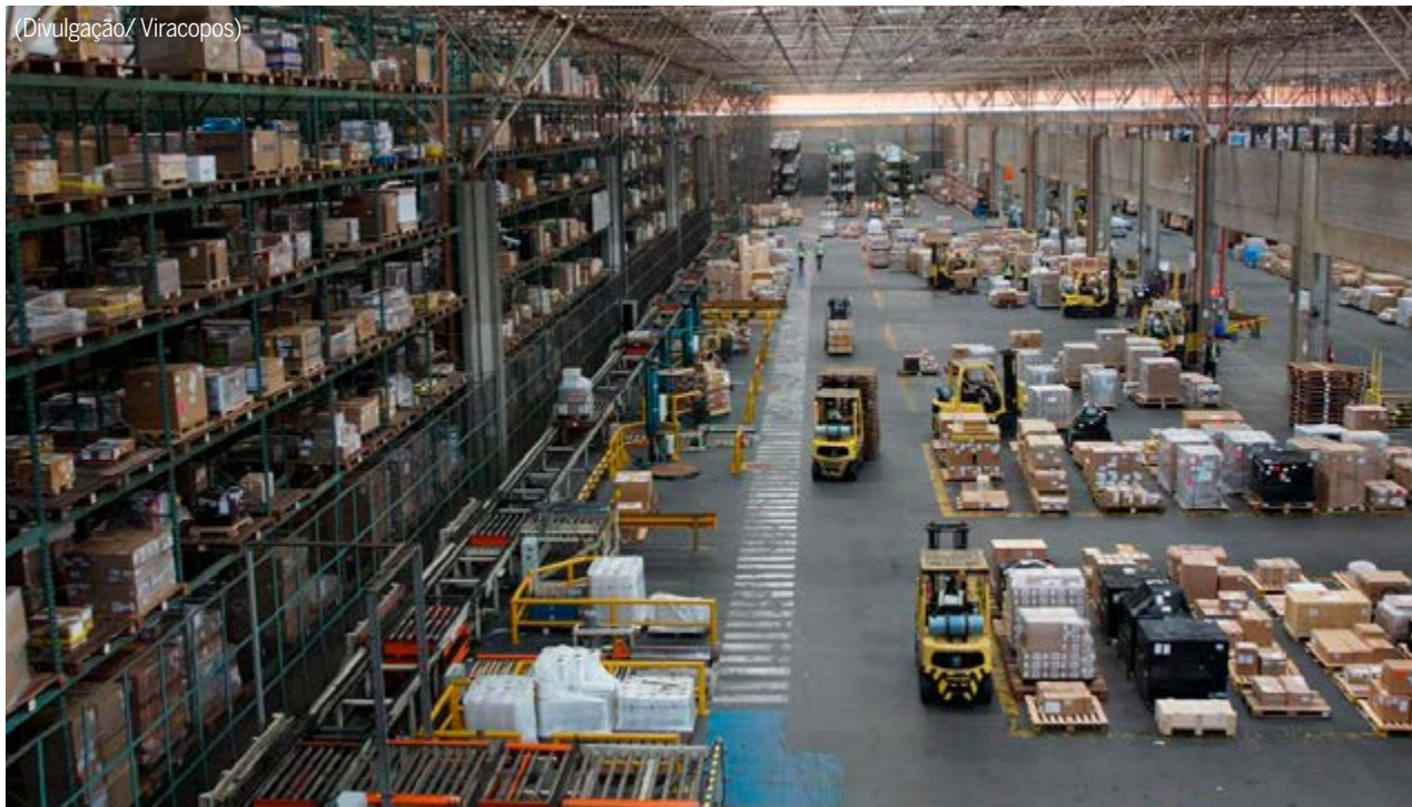
Barracão no aeroporto de Viracopos empresa: cidades da região de Campinas se destacam em levantamento de maiores geradoras de vagas no estado