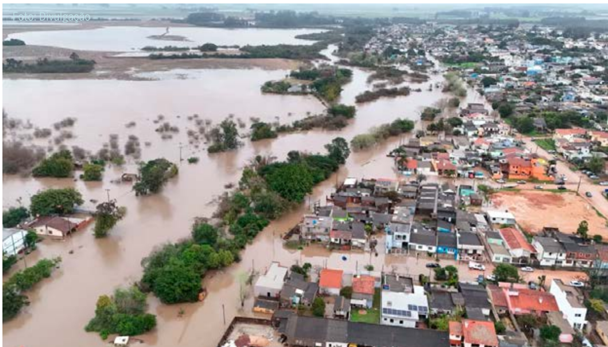
Área alagada no Rio Grande do Sul durante as enchentes de 2024: riscos com o El Niño este ano