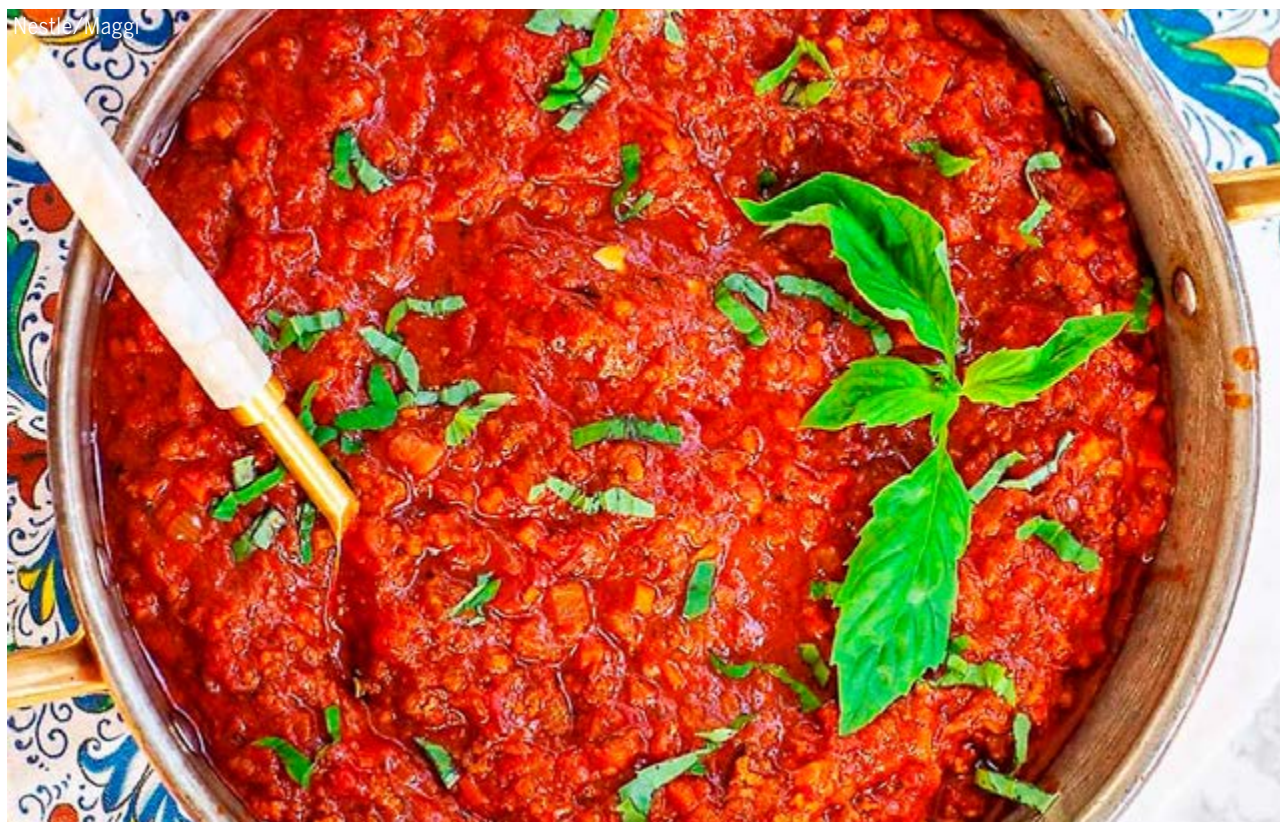
Molho de tomate feito com o refogado de alho, cebola e cenoura: mistura que acrescenta muito sabor à receita