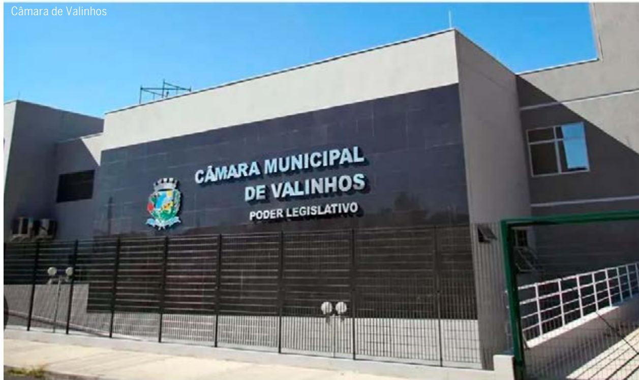
Fachada da Câmara Municipal de Valinhos, que aprovou proposta do prefeito para empréstimos milionários