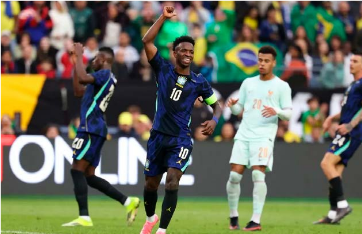
O atacante Vini Junior, do Real Madrid, uma das apostas de Carlo Ancelotti para o Brasil se dar bem na Copa