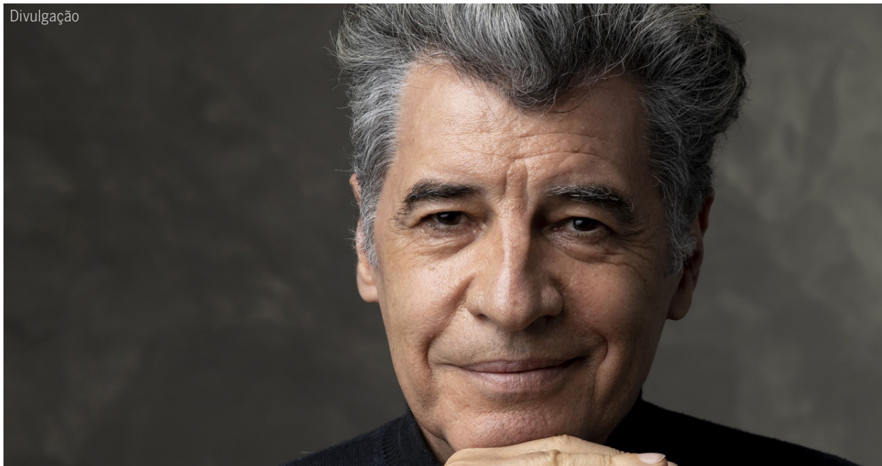
O ator Paulo Betti, que vem a Valinhos para apresentar seu monólogo premiado na próxima semana com entrada gratuita