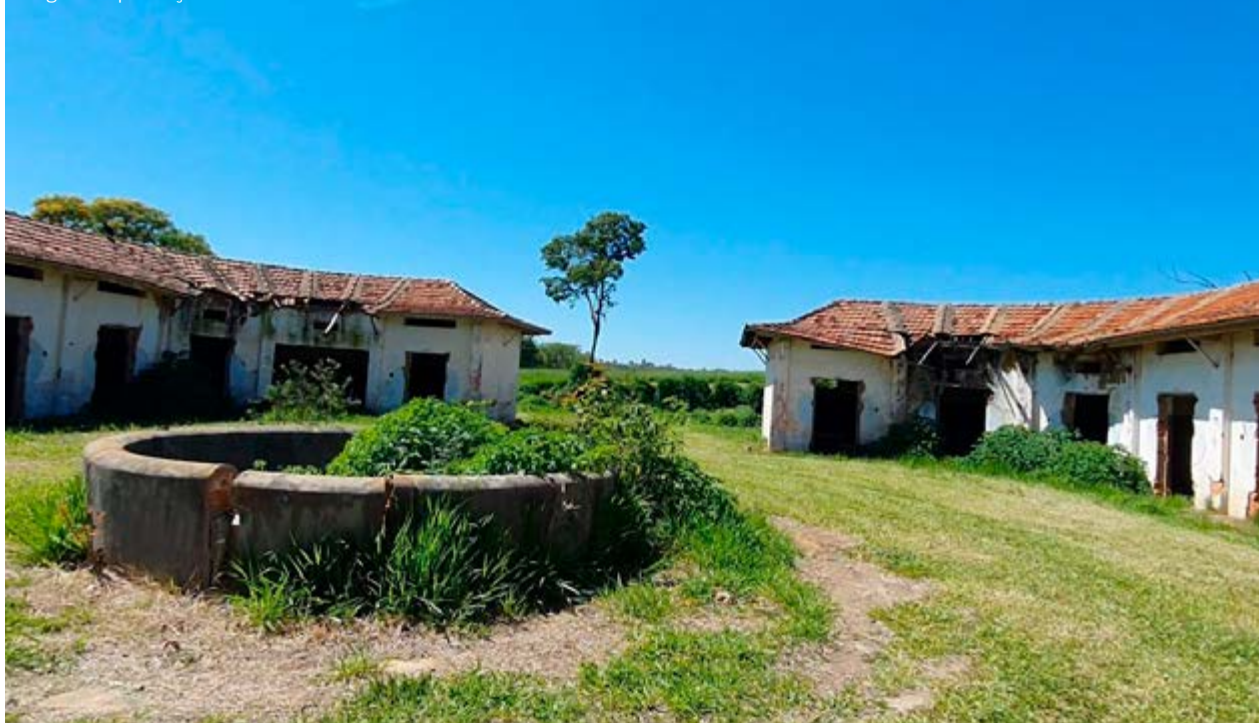
Construções na área da Fazenda Remonta: polêmica em torno de leilão e uso da área após eventual venda