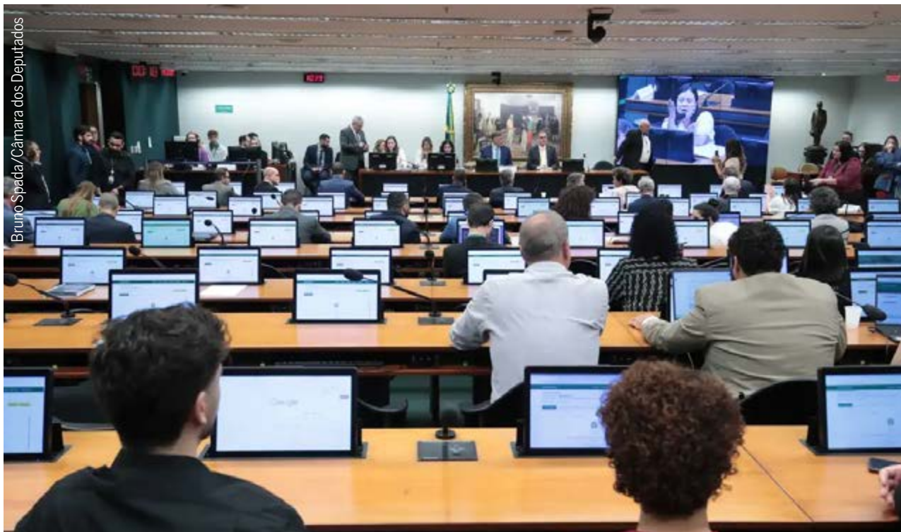
Deputados e convidados durante sessão da Comissão de Constituição e Justiça da Câmara nesta semana