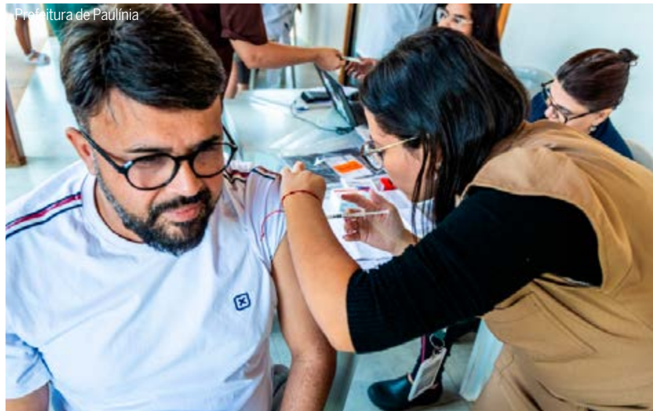
Munícipe recebendo dose de vacina contra influenza; “medida importante para reduzir o risco de complicações”