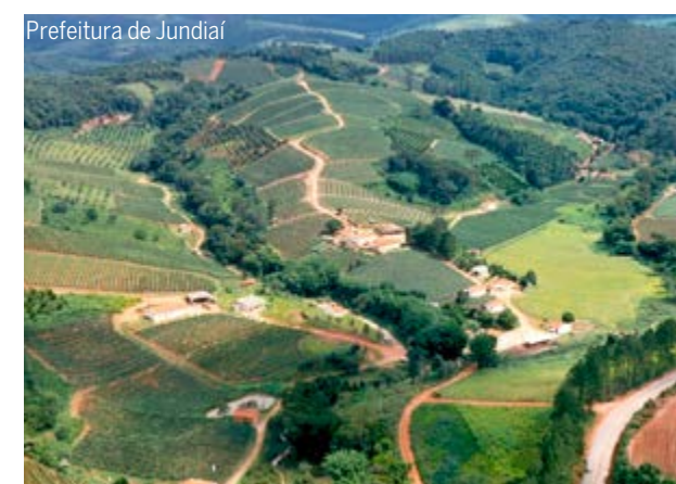
Prefeitura de Jundiá

Reconhecido como uma das principais rotas turísticas do Estado de São Paulo, o Circuito das Frutas reúne municípios com forte tradição agrícola, gastronômica e rural. A proposta do consórcio é promover ações conjuntas para ampliar o fluxo de visitantes, fortalecer a economia regional e valorizar os atrativos turísticos da região de forma integrada.