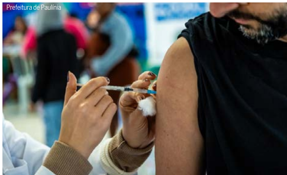
Para receber a dose, é necessário apresentar um documento com CPF.

Na última edição foram aproximadamente 1.400 participantes. Hortolândia conta com 60 quilômetros de ciclovia com meta de atingir 100 quilômetros. As ciclovias são parte das avenidas modernizadas e projetadas, além de ser contrapartida para implantação de novas vias e empreendimentos.