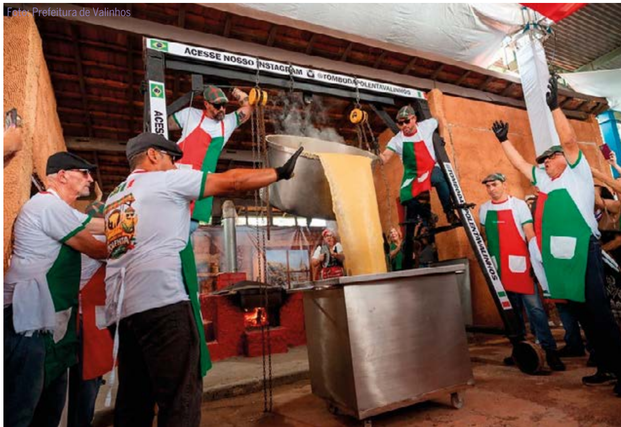
Participantes do Tombo da Polenta durante apresentação em Valinhos: atração gratuita na Festa Italiana na cidade