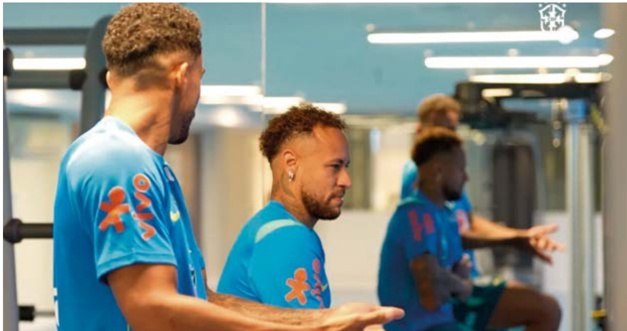
O atacante Neymar se exercita em bicicleta depois da apresentação de parte dos convocados na Granja Comary