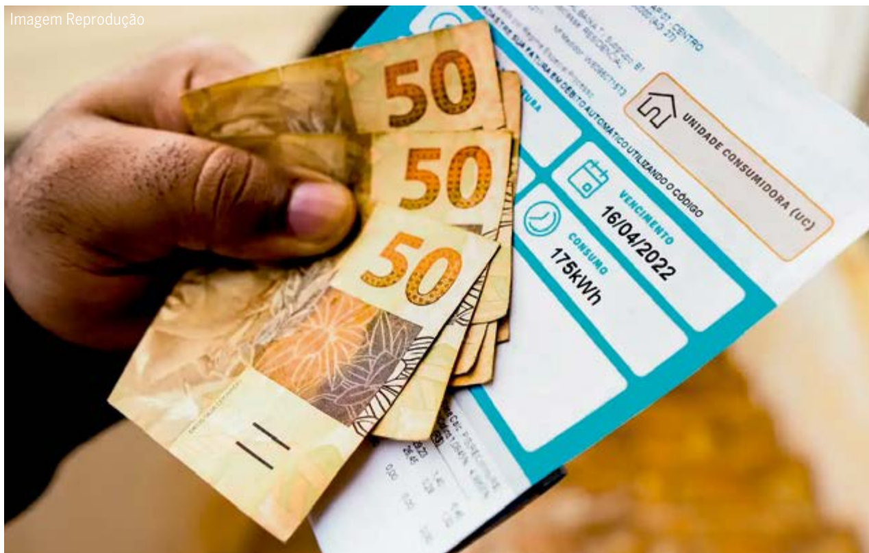
Consumidor com dinheiro para pagar a conta de luz: isenção pode ser solicitada para CPFL na região