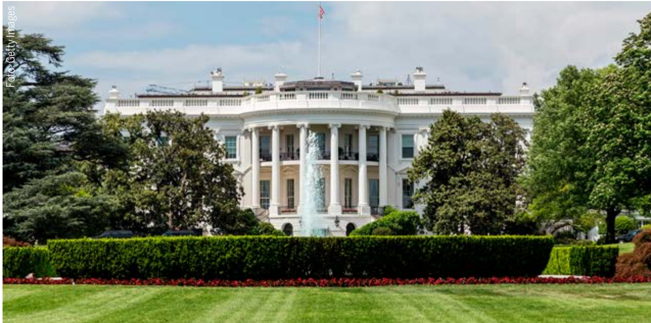
Imagem da Casa Branca, sede do governo do presidente dos Estados Unidos, Donald Trump