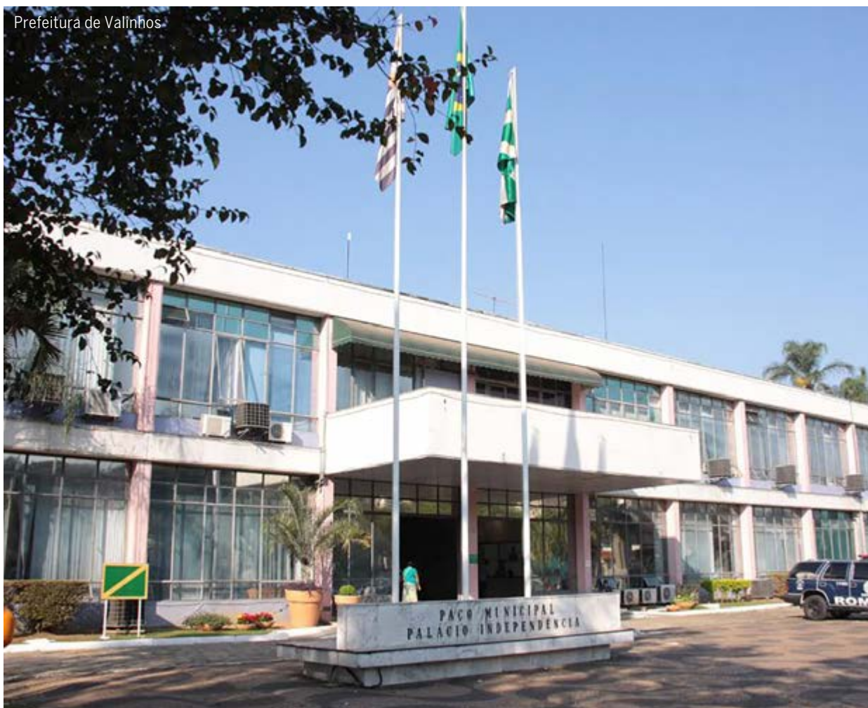
Prefeitura de Valinhos