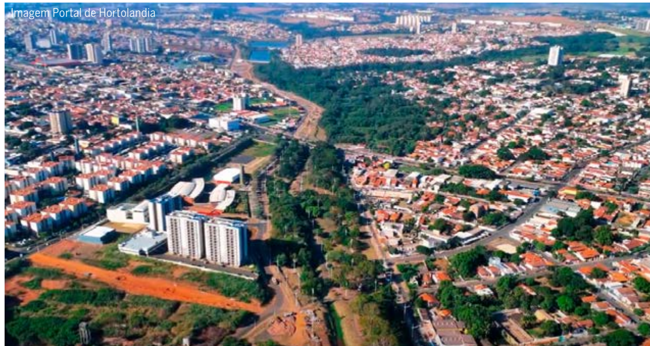
Imagem Portal de Hortolândia Vista aérea da cidade de Hortolândia, que se destacou ao subir em ranking de qualidade de vida na região