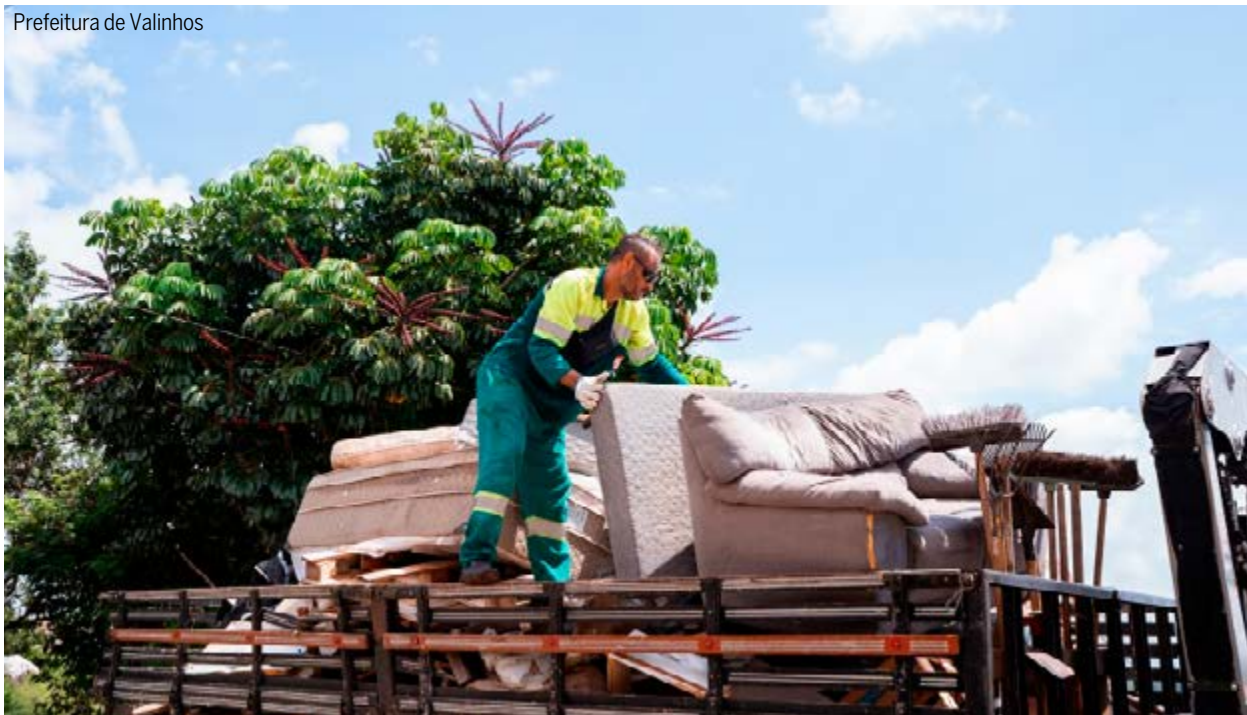
Funcionário que presta serviço para a Prefeitura durante ação de limpeza realizada em Valinhos