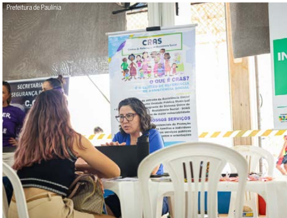
A ação tem início às 9 horas da manhã conta com diversos agentes públicos

A Prefeitura de Hortolândia apoia o Maio Amarelo. O movimento internacional de conscientização para reduzir sinistros e mortes no trânsito, com foco na segurança viária, foi criado em 2011 com o objetivo de promover ações educativas durante todo o mês de maio, utilizando a cor amarela para simbolizar atenção e advertência. Em 2026, o tema foca em “paz no trânsito” e “enxergar o outro”.