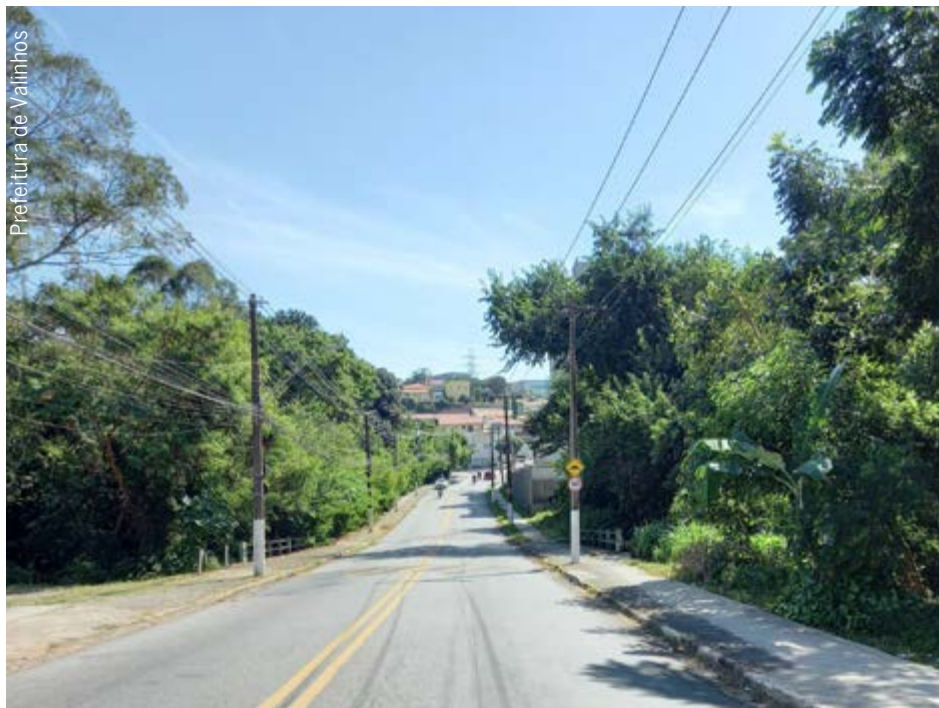
Área próxima da residência da mulher que morreu vítima de febre maculosa em Valinhos