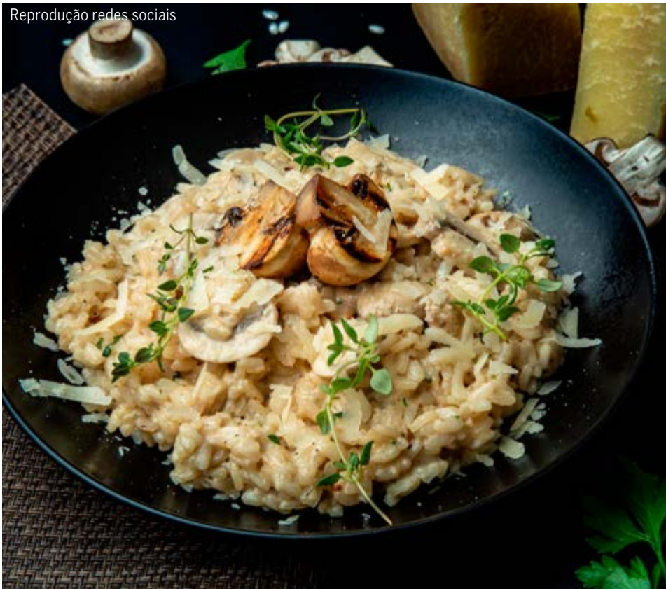
Risoto com cogumelos, prato de execução simples e que agrada aos paladares mais variados