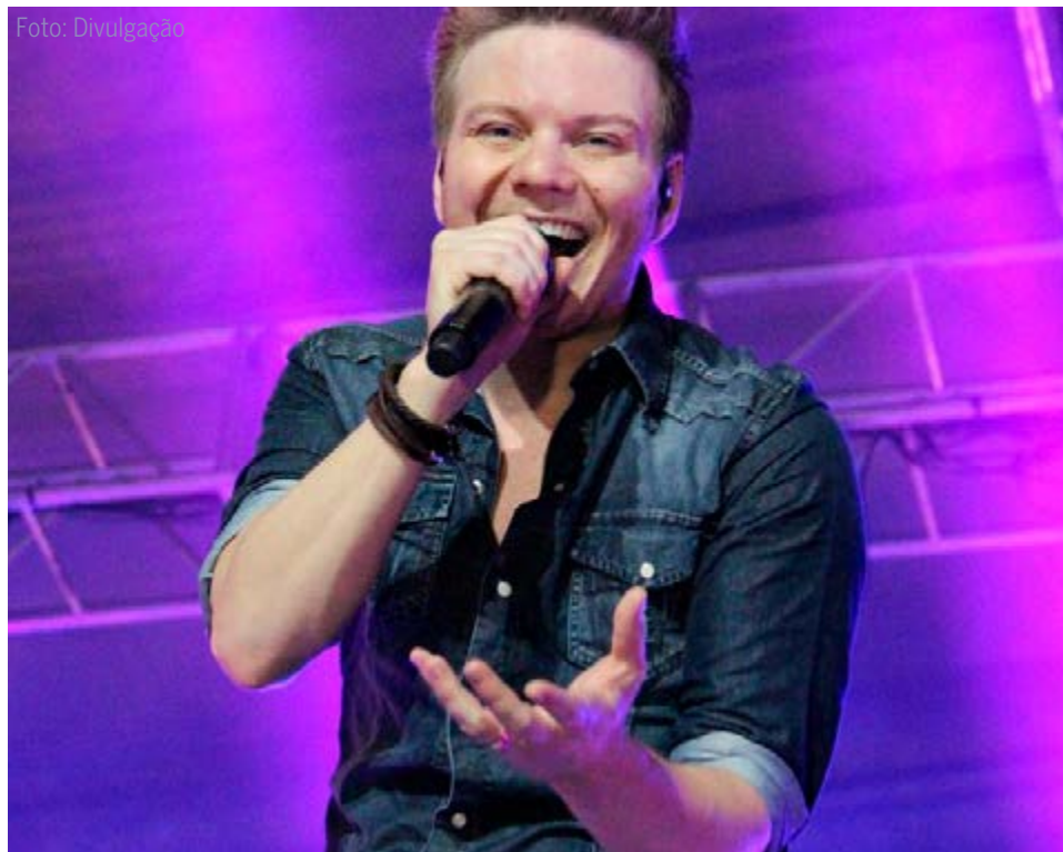
O cantor Michel Teló, que será uma das atrações da Virada Cultural de São Paulo neste final de semana