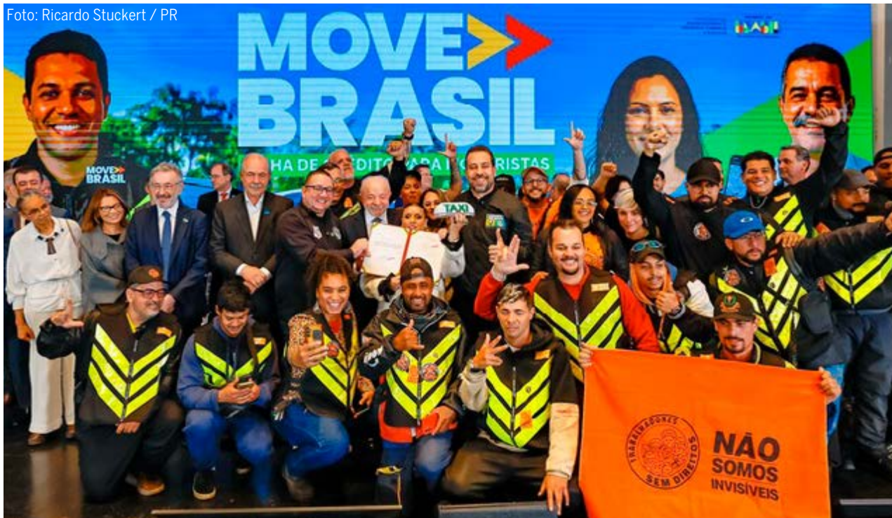
O presidente Lula com motoristas de aplicativo e motoboys durante o anúncio do programa com a linha de financiamento