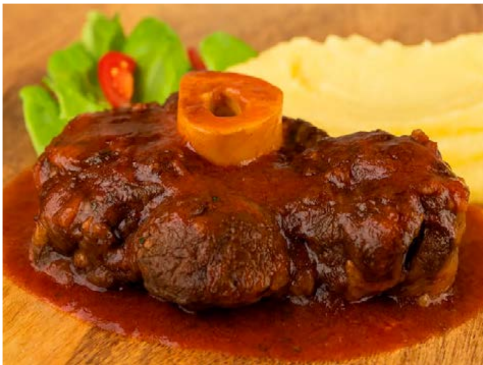
Ossobuco com purê de batatas: corte tradicional na culinária italiana ainda é pouco conhecido