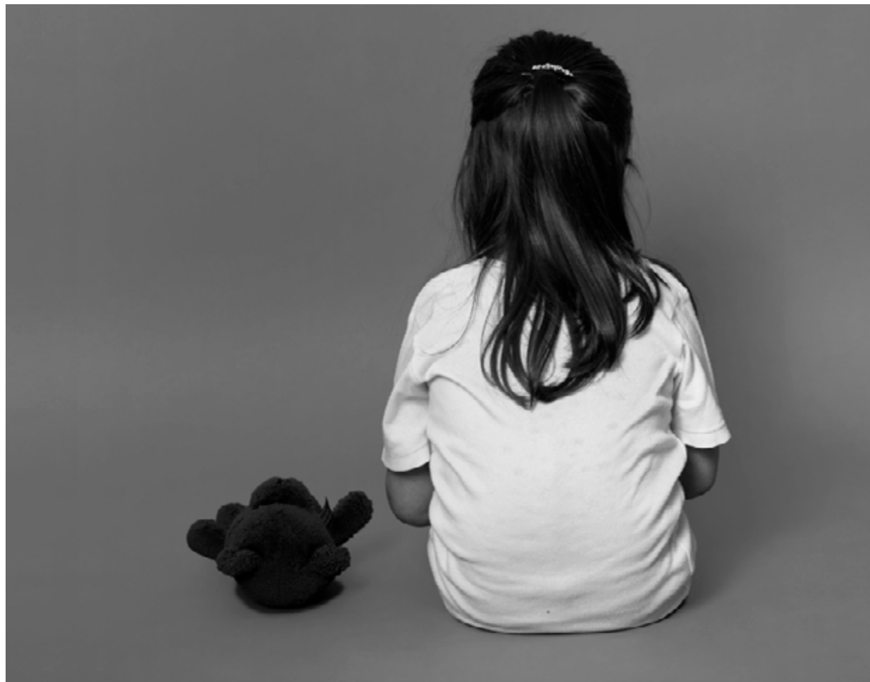
Programa ACT – Para Educar Crianças em Ambientes Seguros é voltado a pequenos de até 8 anos de idade em escolas municipais