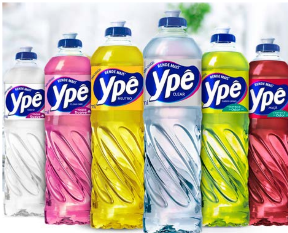
Produtos da Ypê, que tem fábrica em Amparo e teve diversos itens suspensos nesta semana