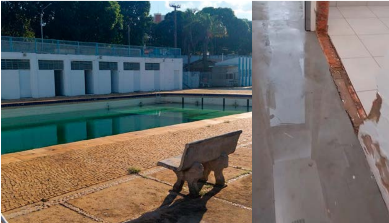
Imagens mostram piscina com água verde, banheiro com problemas, água parada em corredores e o abandono do antigo clube da Rigesa