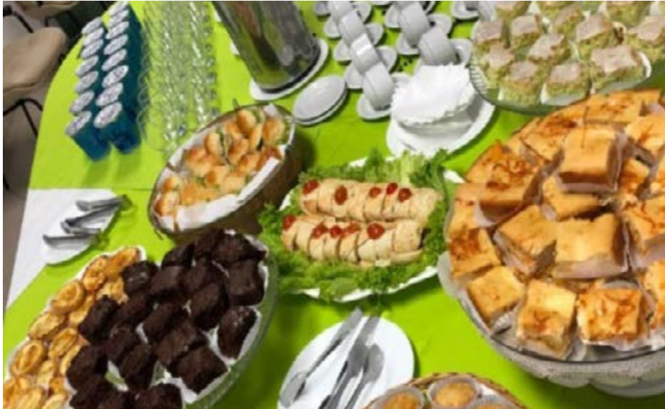
Imagens do Instagram mostram serviços da empresa contratada para a ata de registro de preços em Valinhos