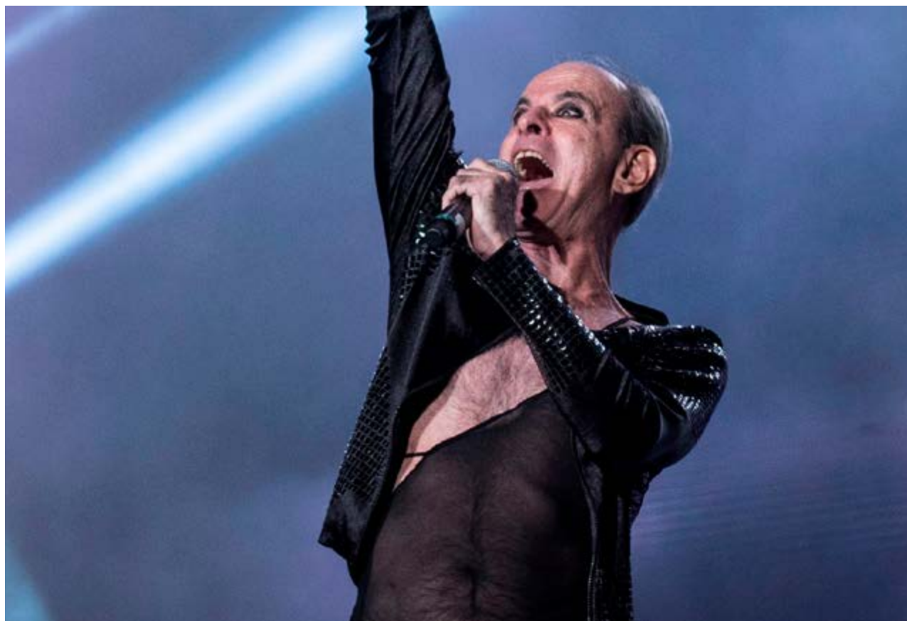
O cantor e compositor brasileiro Ney Matogrosso, atração em Campinas neste final de semana