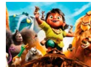
Melhor Filme (BIFF Junior): A Arca de Noé , de Sérgio Machado