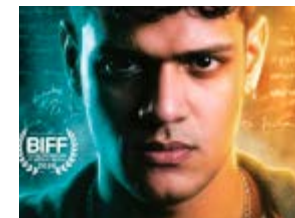
Menção Honrosa (Júri Oficial): Hungria – Em Busca de um Sonho