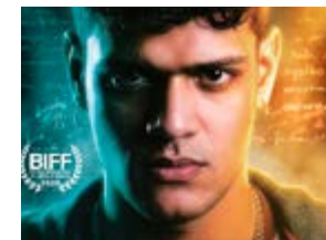
Melhor Filme (Júri Popular): Hungria – A Escolha de um Sonho