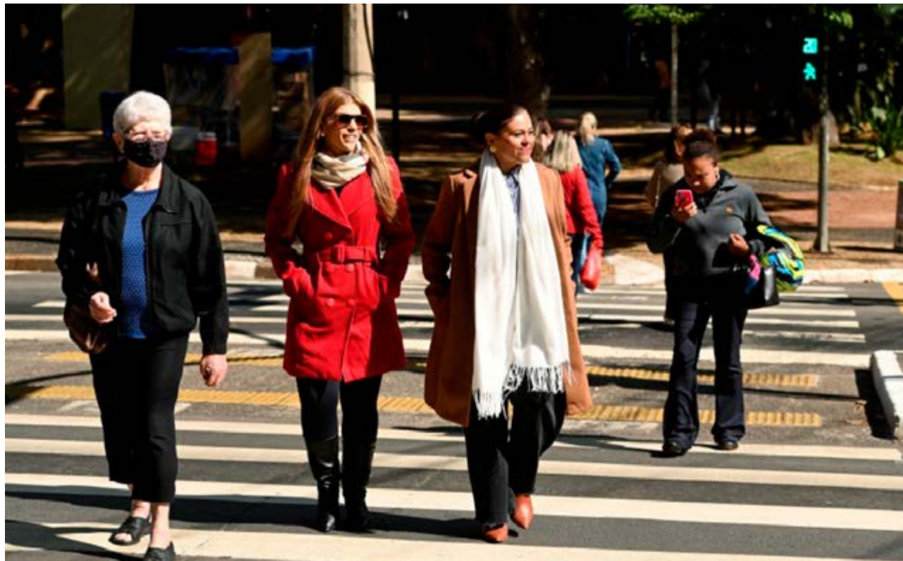
Pessoas caminham agasalhadas: expectativa de baixas temperaturas no Estado de São Paulo neste final de semana