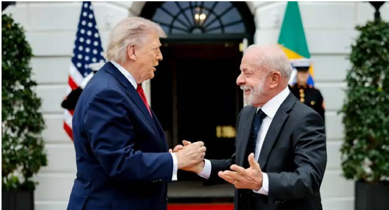
Lula e Trump se cumprimentam durante encontro na Casa Branca, em Washington, na última quinta-feira