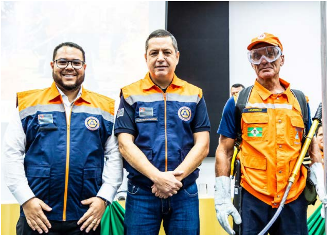
Prefeito de Paulínia Danilo Barros "A medida é essencial para manter a nossa rede preparada para atender as situações socorro imediato".