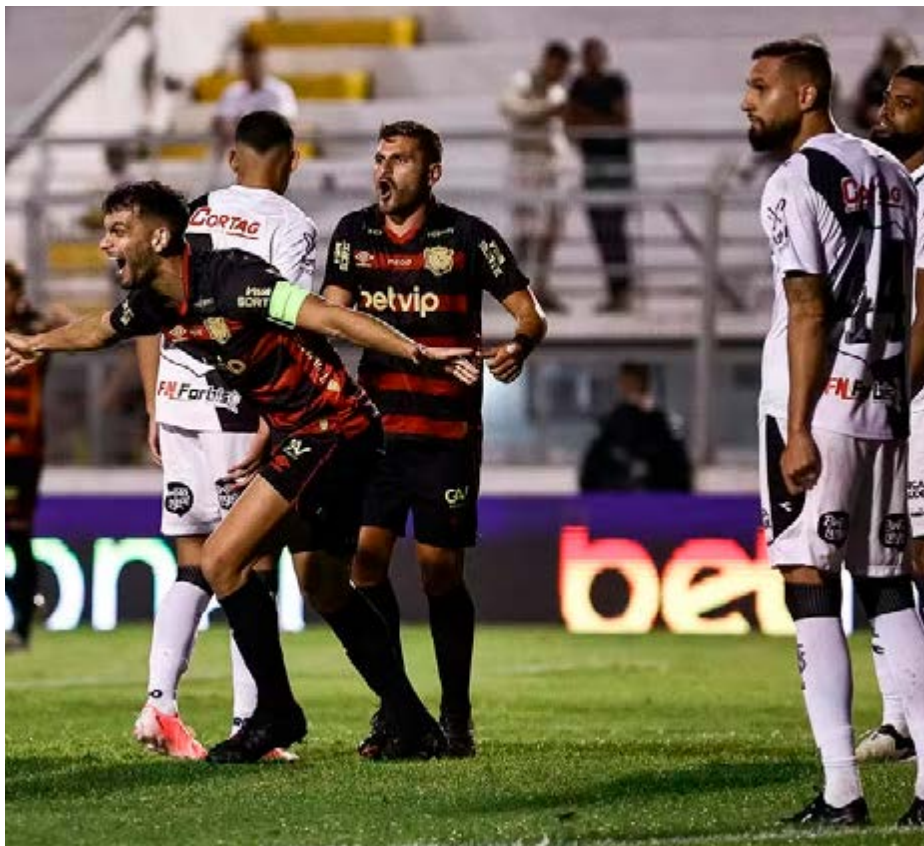
Lance de jogo da Macaca contra o Sport pelo Brasileiro da Série B: duelo complicado neste final de semana