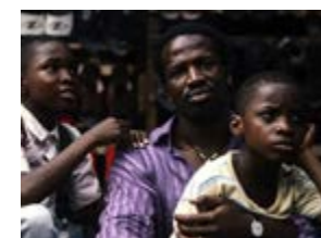
Melhor Filme (Júri Oficial): A Sombra do Pai