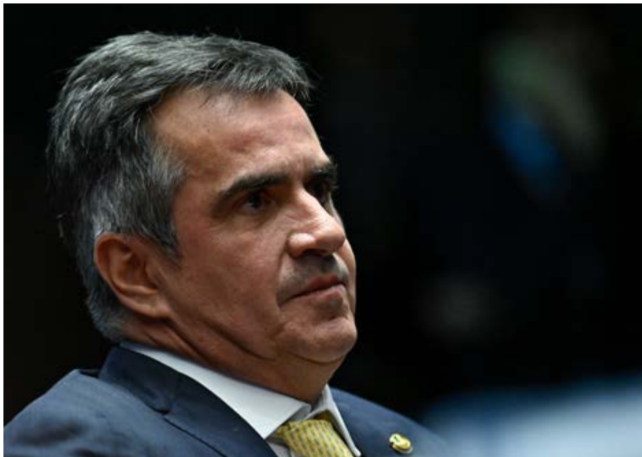
O senador Ciro Nogueira, investigado pela PF sobre supostas irregularidades do Banco Master

Jornalista graduado pela PUC-Campinas e apaixonado pelo mundo de economia e negócios.