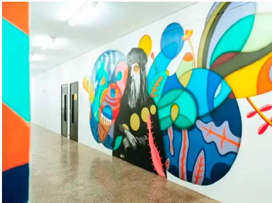
Arte em Valinhos: R$ 886 mil destinados como incentivo ao setor na cidade