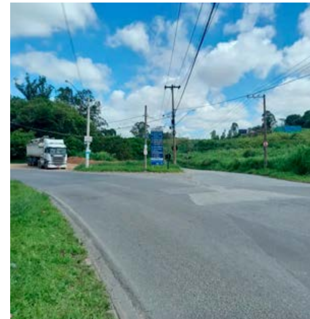
Concretagem tornará o pavimento mais resistente

A substituição do asfalto pela concretagem tornará o pavimento mais resistente para suportar o fluxo de veículos pesados que circulam pela região. O asfalto que reveste a via atualmente é irregular e demanda manutenções frequentes. O novo pavimento vai exigir menos manutenções, o que vai garantir uma melhor fluidez de veículos no local.