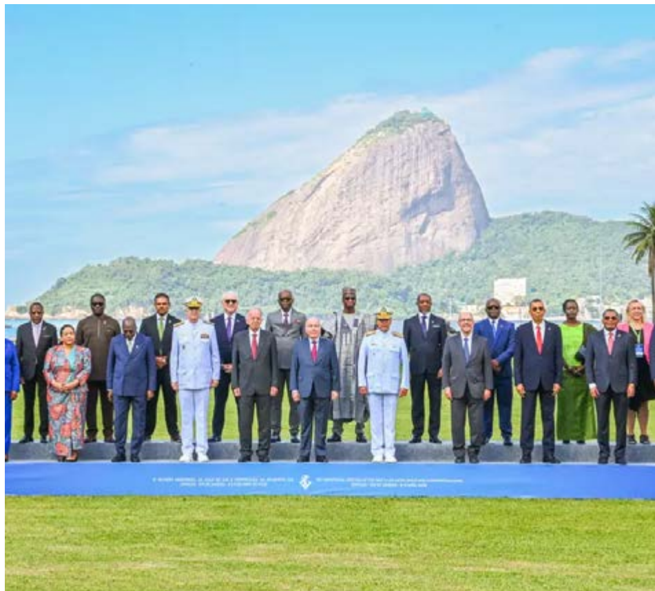
Líderes dos países que integram o Zopacas posam para foto no Rio após encontro