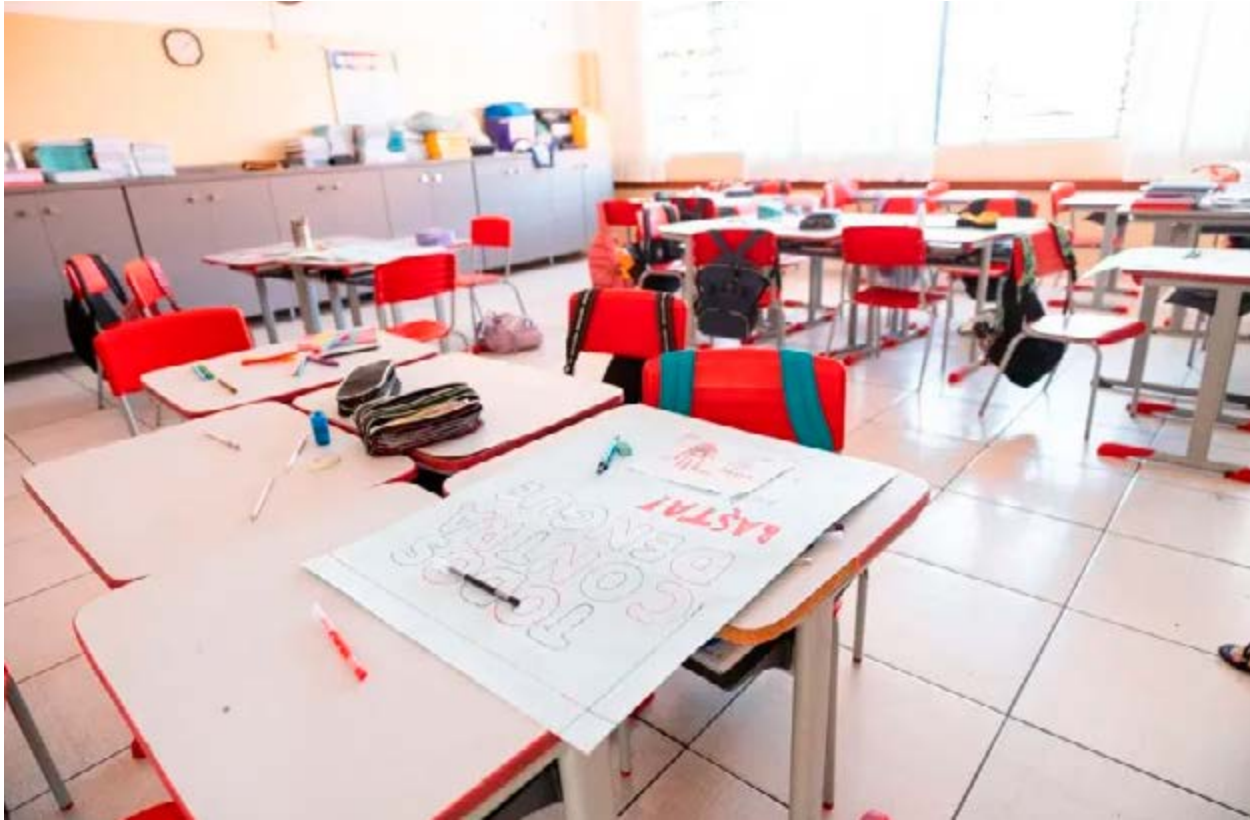
Material em sala de aula: alerta sobre produtos em almoxarifado da educação em Valinhos