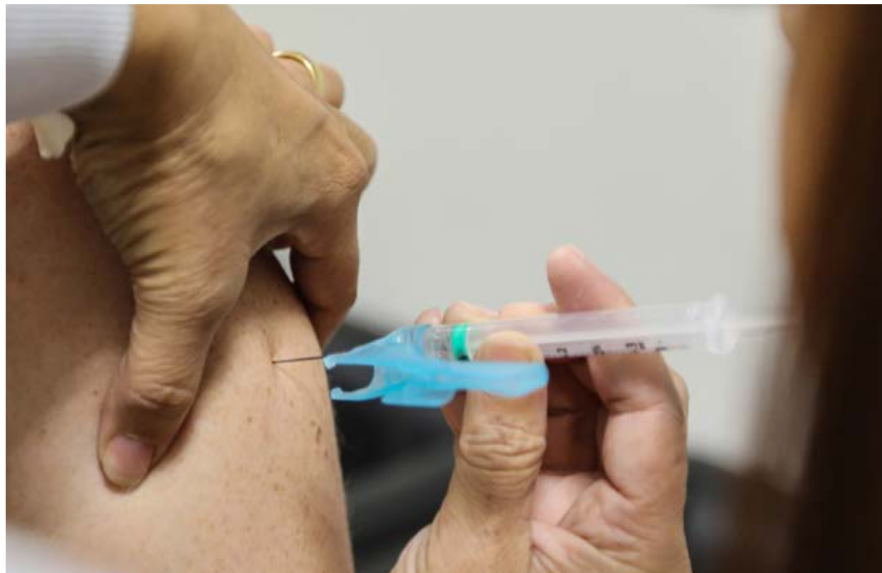
Profissional da Saúde aplica vacina contra a gripe: Valinhos terá ações especiais neste final de semana