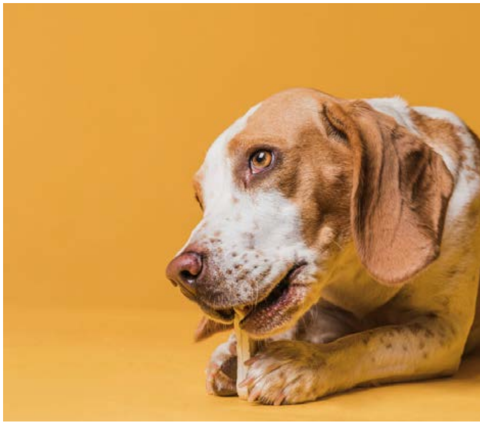
Cachorro brinca com objeto: campanha em Valinhos foca em prevenção a casos de violência e abandono