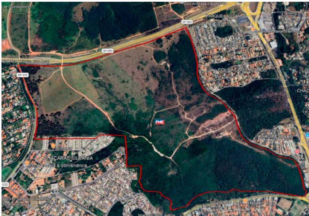
Imagem mostra área da Remonta que deve ser vendida pelo Exército em Valinhos em breve

ganha contornos ainda mais relevantes diante de uma decisão recente da Prefeitura. No início da gestão do prefeito Franklin Duarte (PL), em 2025, o primeiro decreto assinado teve como foco justamente a preservação da Fazenda Remonta. A medida anulou a Diretriz 31/2023, emitida pela então prefeita Capitã Lucimara, que autorizava a implantação de um grande empreendimento imobiliário na área.