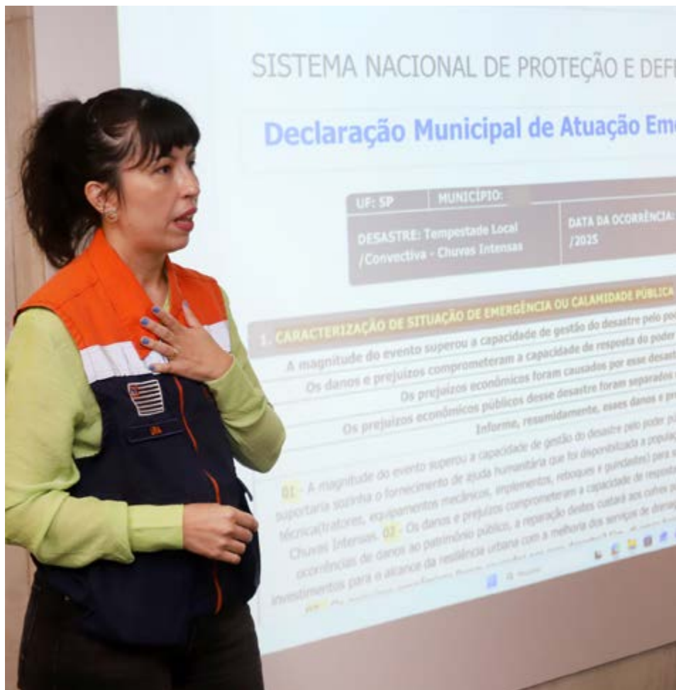
Durante evento, foram apresentadas experiências do Rio da Janeiro e de São Paulo