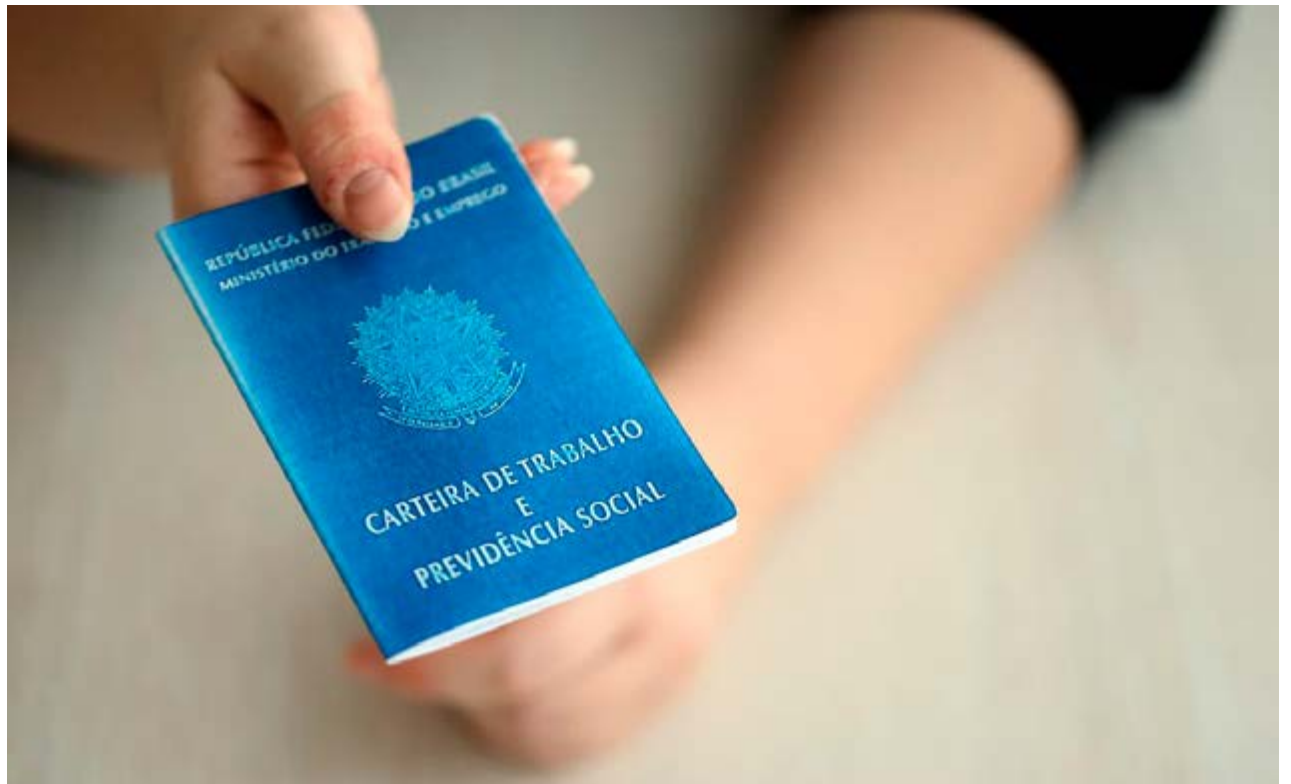
Carteira de Trabalho, que segundo pesquisa ainda é forma preferida de vínculo no Brasil

Setorialmente, serviços liderou as contratações na região, com 33.875 admissões (54,14% do total), seguido pelo comércio (21,00%), indústria (15,50%), construção (7,96%) e agropecuária (1,39%). A composição reforça o perfil econômico diversificado da região, com forte presença do setor de serviços e base industrial consolidada.