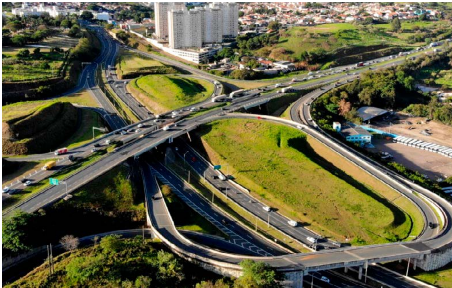
Imagem do trevo de acesso do Anel Viário entre Valinhos e Campinas: obras aguardadas por toda a região