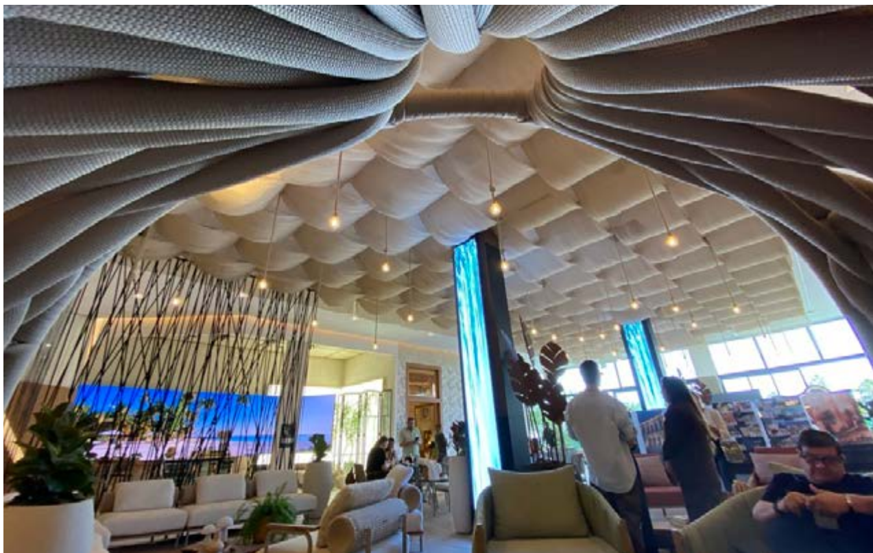
Um dos ambientes da Campinas Decor 2026, que acontece nesse ano do Royal Trade Center, em Campinas