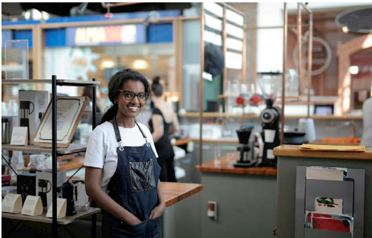
Mulher trabalha em empresa de alimentação: maioria lidera negócios na região de Campinas

Até fevereiro de 2026, 10.617 carros eletrificados circulavam pelas ruas de Campinas, revela levantamento da Associação Brasileira do Veículo Elétrico (ABVE). Além de mostrar o apetite dos proprietários por energias renováveis, o índice representa a maior frota de todo o interior brasileiro, com 1,79% de participação nacional. O número também supera algumas capitais, como, por exemplo, Fortaleza (CE), Recife (PE) e Florianópolis (SC).