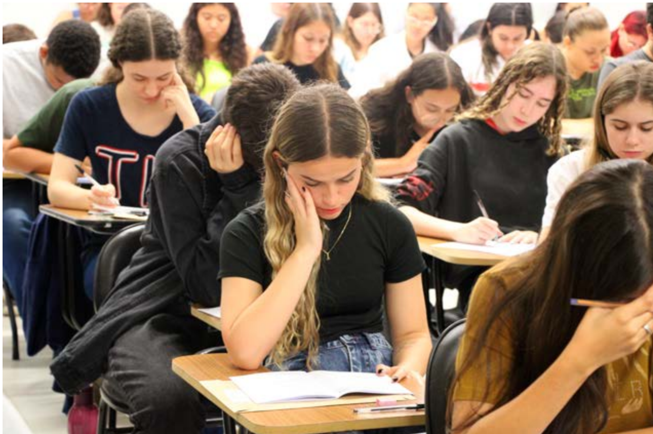
Estudantes durante exame vestibular: inscrições da Unicamp começam no mês de agosto neste ano