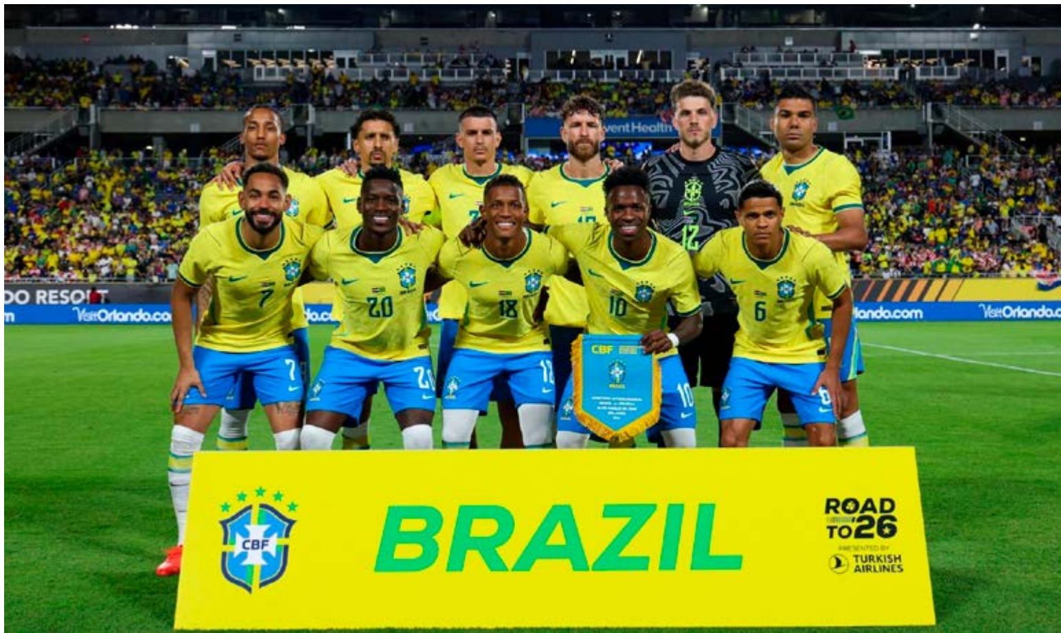
Seleção Brasileira antes da partida contra a Croácia, nos Estados Unidos: vitória em revanche após eliminação em 2022