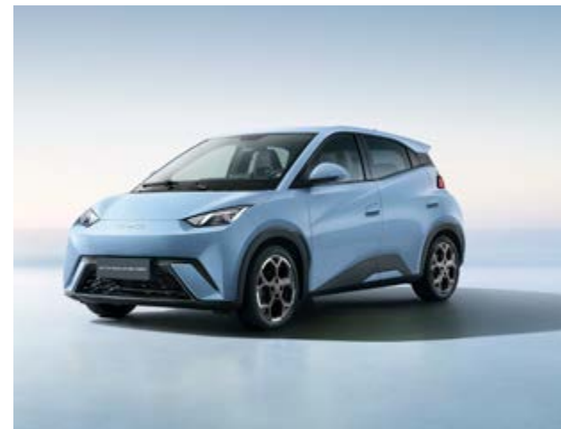
BYD Dolphin Mini, o carro elétrico mais vendido do Brasil.

ção de empregos, atração de fornecedores, fortalecimento da indústria e aumento da arrecadação. Por isso, a capacidade de articulação e planejamento do município será decisiva para transformar a oportunidade em realidade. Em um momento de expansão do setor de mobilidade elétrica no mundo, a disputa por um projeto desse porte também revela a importância de estratégias bem estruturadas de desenvolvimento econômico. Para Valinhos, a chegada da BYD pode representar um salto relevante — mas depende, sobretudo, de protagonismo e eficiência na condução das negociações. A reportagem entrou em contato com a Secretaria de Comunicação da Prefeitura para saber se houve algum contato da BYD e, em caso afirmativo, como estão as conversas. Até o fechamento desta edição, não houve nenhuma resposta.