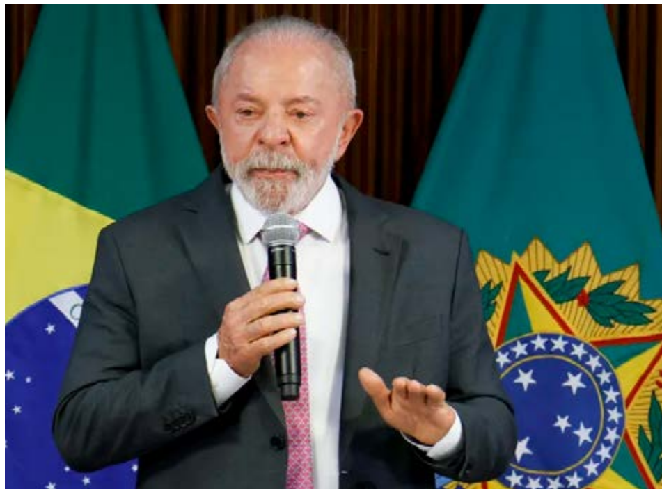
O presidente Lula fala durante solenidade em Brasília: antiga reivindicação atendida