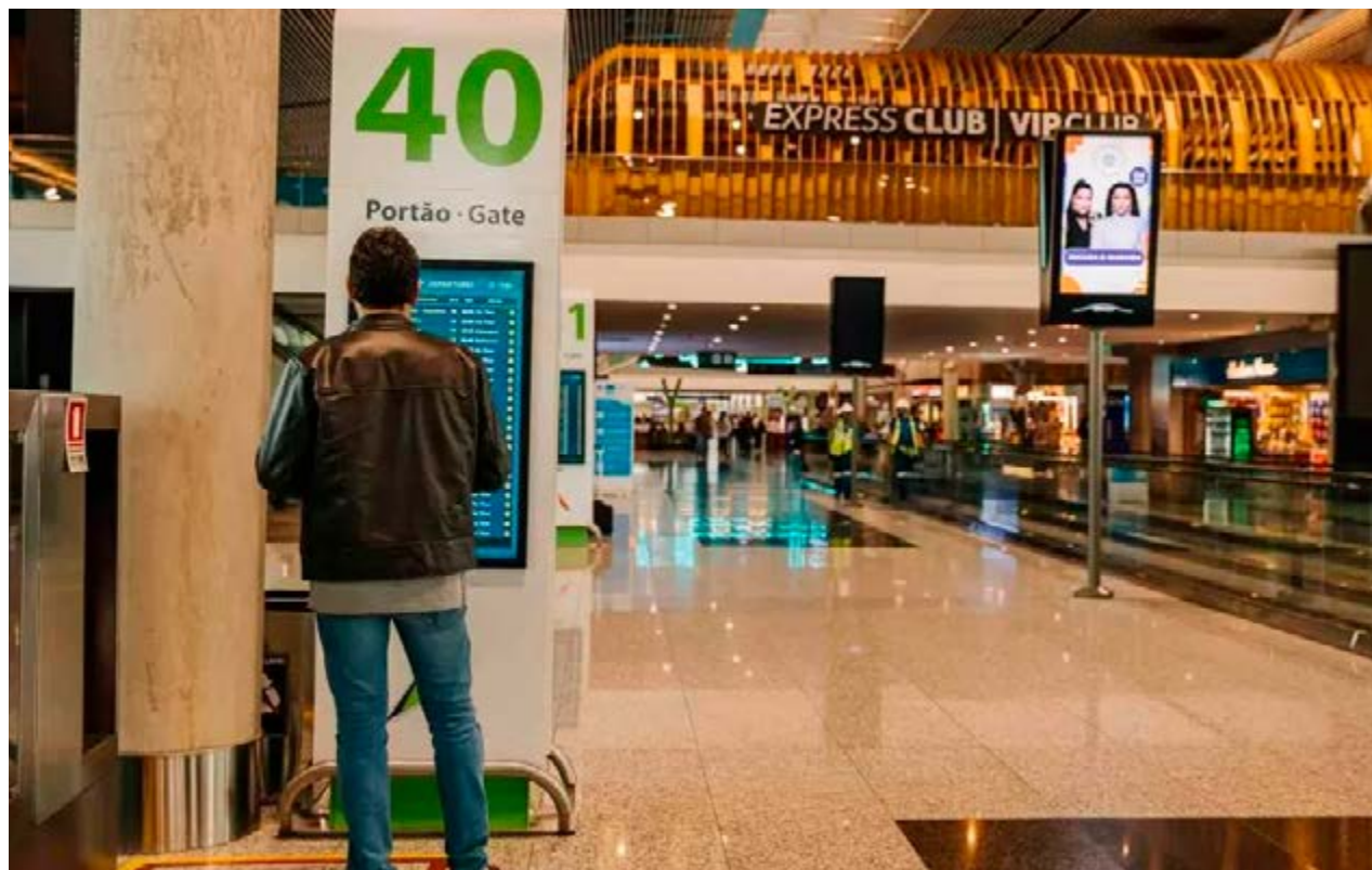
Em aeroporto, homem observa painel com horários de voos: preços de passagens podem disparar