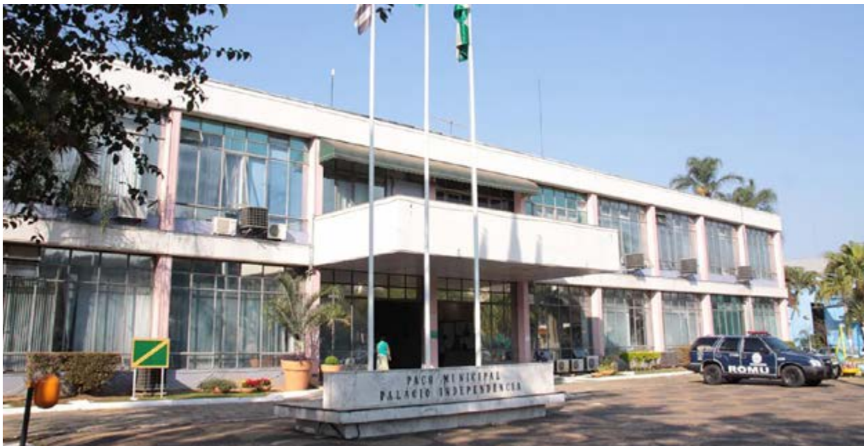
Fachada da Prefeitura de Valinhos: decisão da Justiça aponta práticas contra a atividade sindical