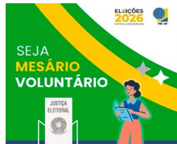
Arte da Camoanha oficial do Governo Federal

https://www.justicaeleitoral.jus.br/eleicoes/mesario/