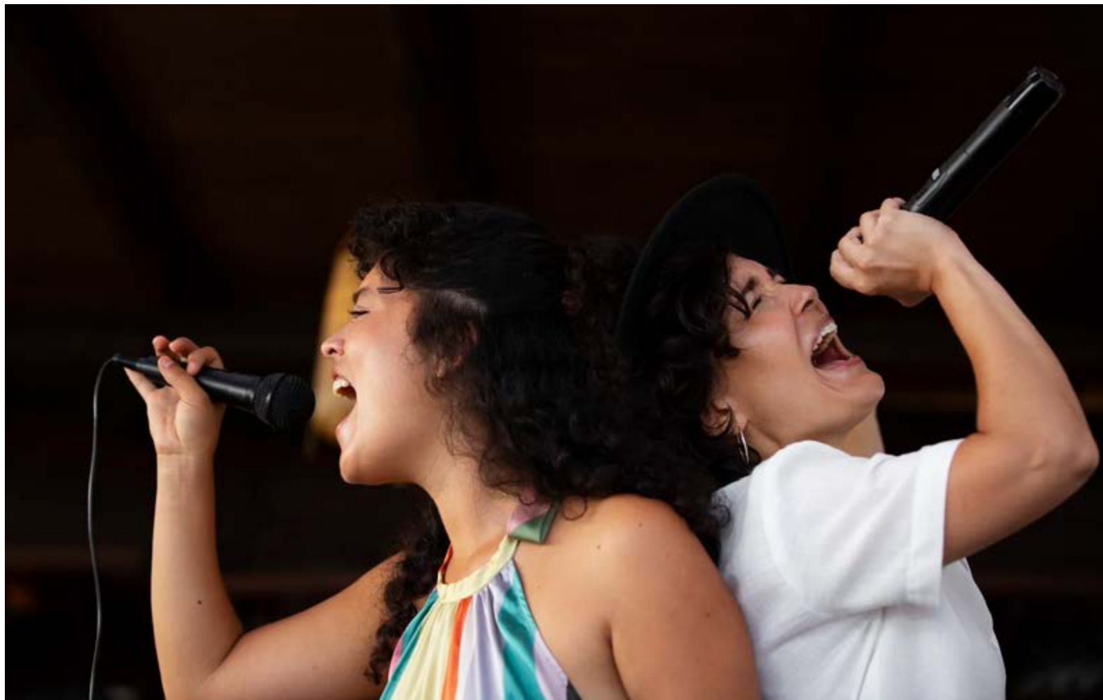
Cantoras durante apresentação de coral: apresentações de encontro serão em maio em Valinhos