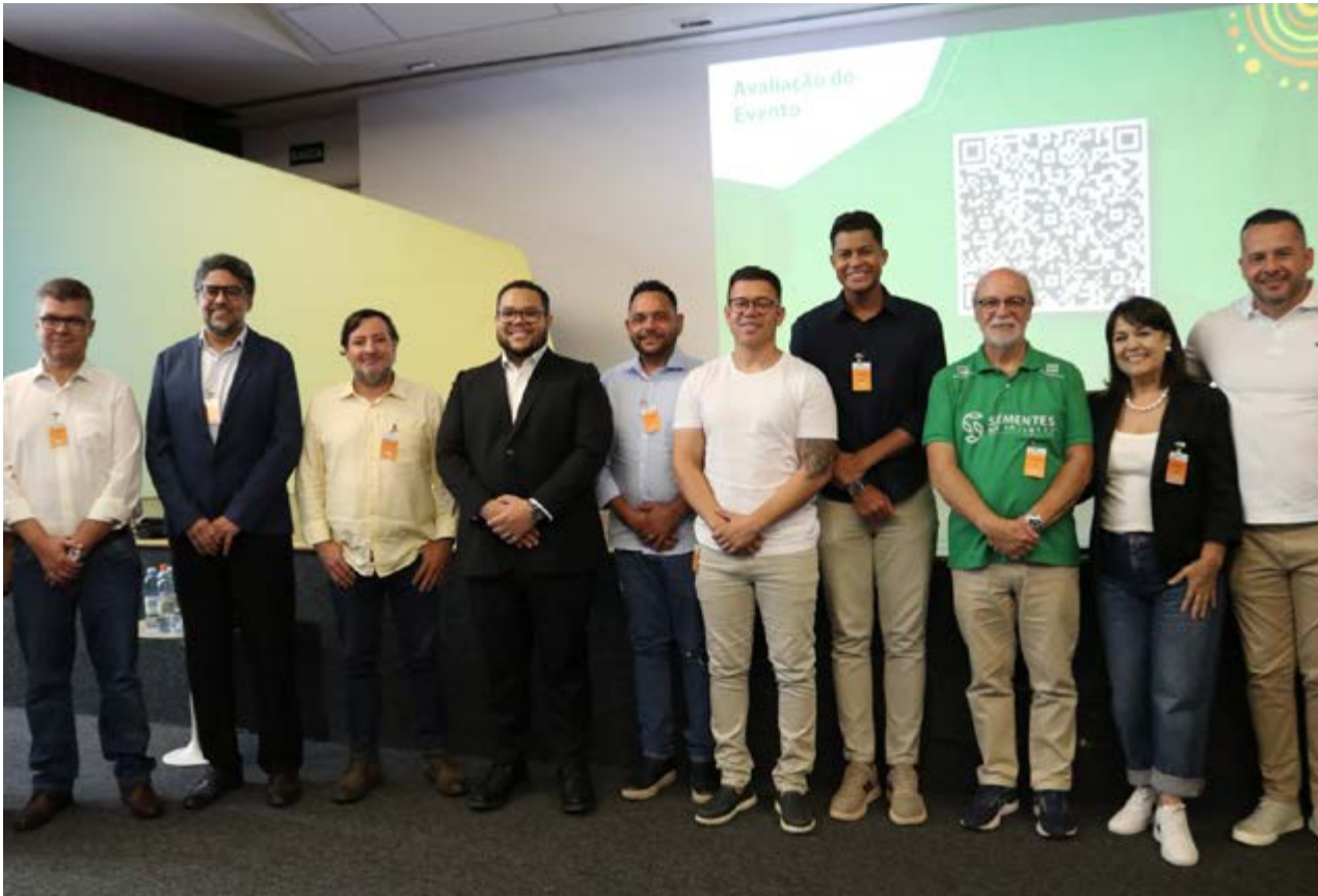
Prefeito de Paulínia Danilo Barros e secretários participaram de cerimônia nesta última quarta-feira 1º de abril