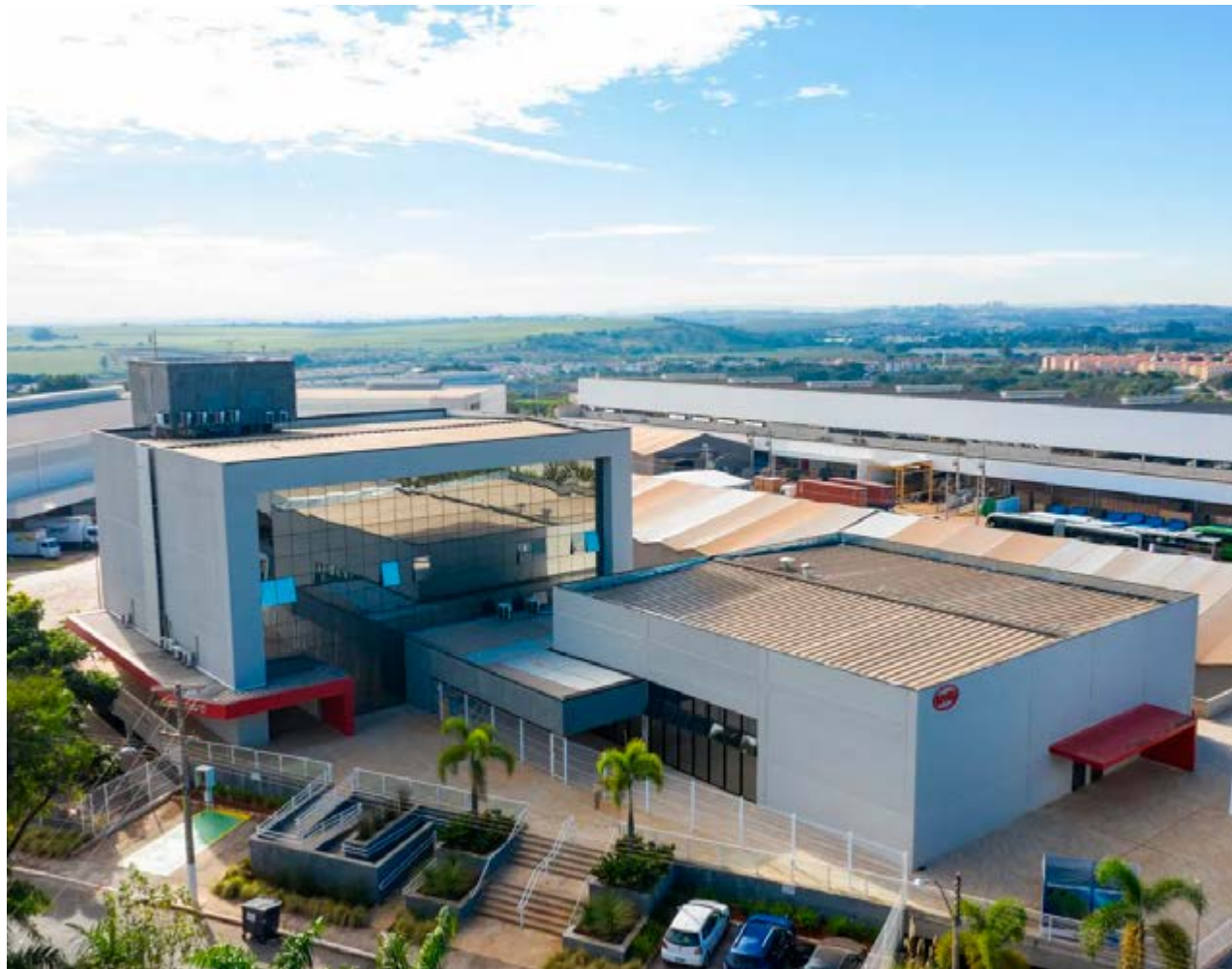
Uma das fábricas da BYD no Brasil: nova planta na região deve ter áreas de até 500 mil metros quadrados