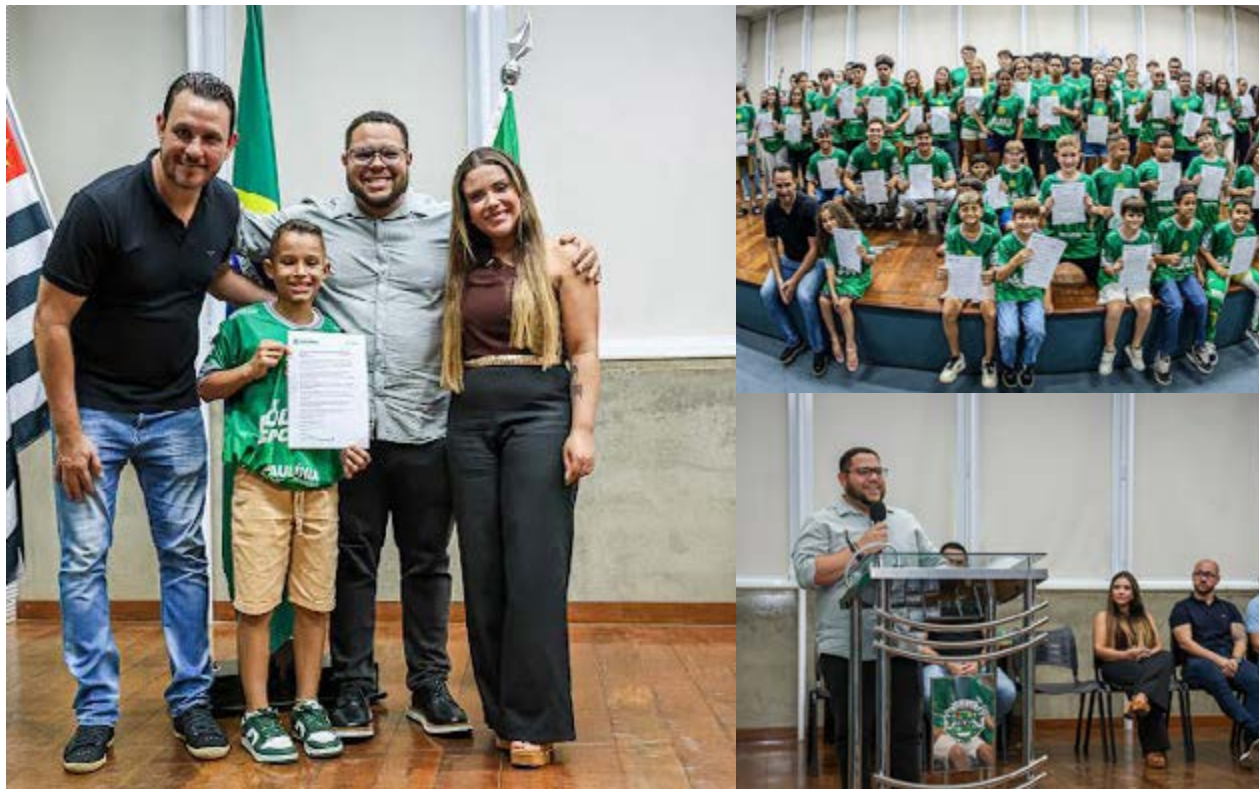
Ao todo, foram 73 bolsas esportivas contempladas para os atletas e paratletas do município de Paulínia