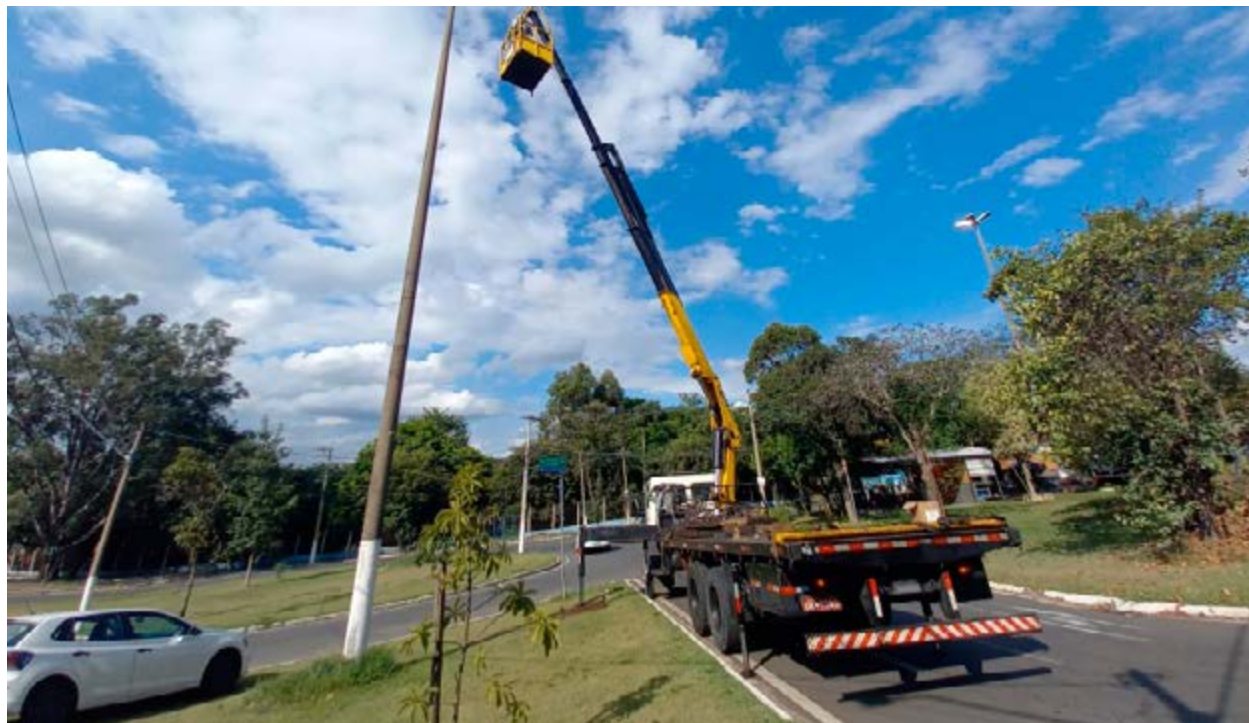
Caminhão durante serviço de manutenção da iluminação pública em rua de Valinhos

Dia D de Combate à Dengue - Campanha Regional Juntos Contra a Dengue EPTV Data: 28 de fevereiro (sábado) Horário: das 8h30 às 12h30 Local - Prefeitura de Valinhos Endereço: Rua Antônio Carlos, 301. Centro