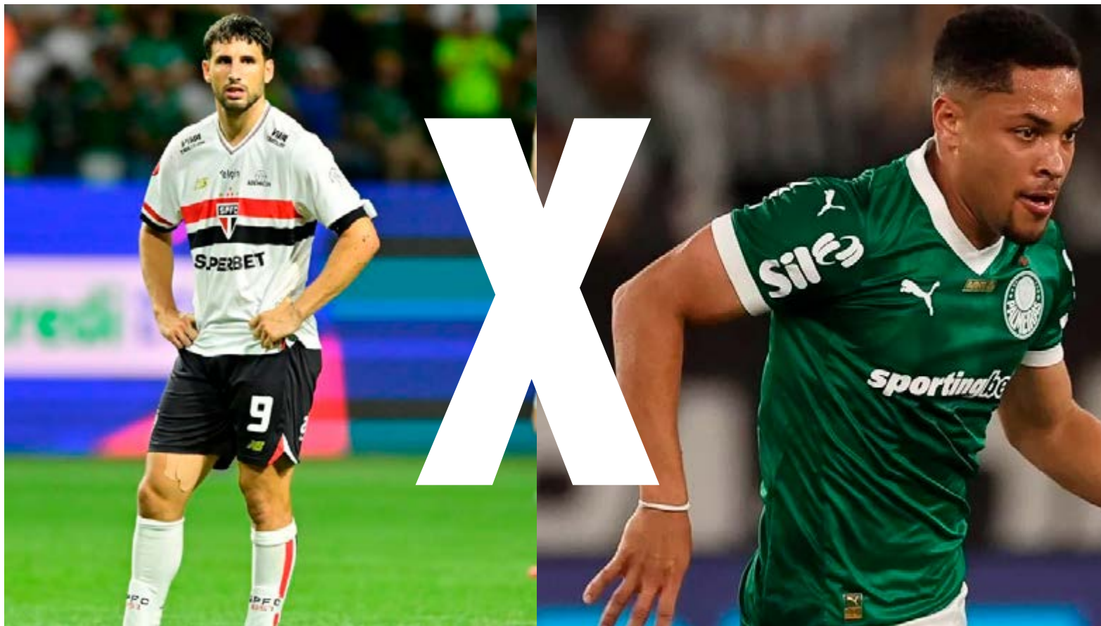
Calleri, do São Paulo, e Vitor Roque, do Palmeiras, adversários na semifinal de domingo