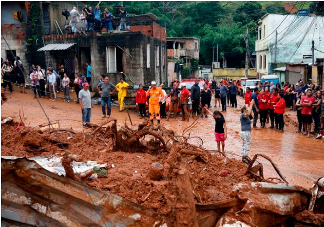
Estragos causados pelas chuvas em Juiz de Fora durante a semana: população em área de risco preocupa