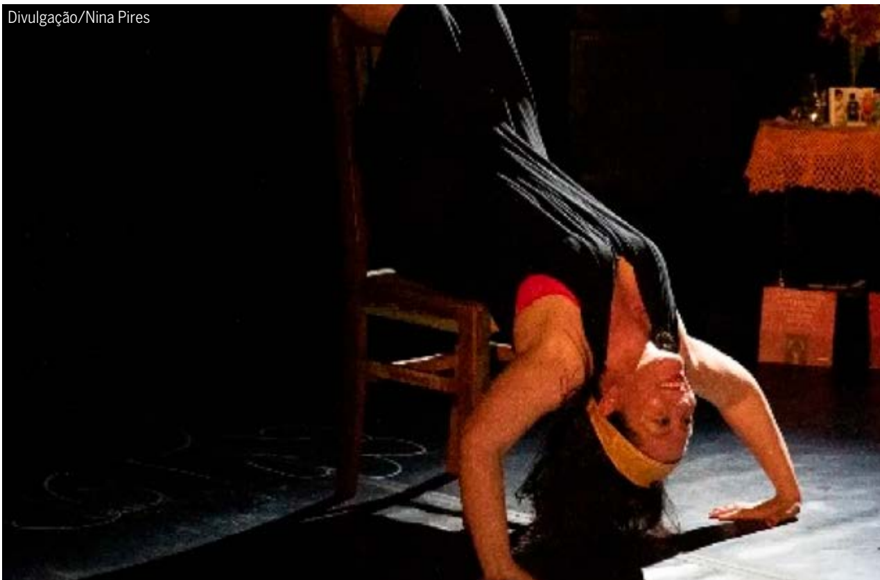
Trecho de espetáculo do Terra Lume 2026, que celebra 40 anos do grupo e 10 anos do curso Bastidores da Cena