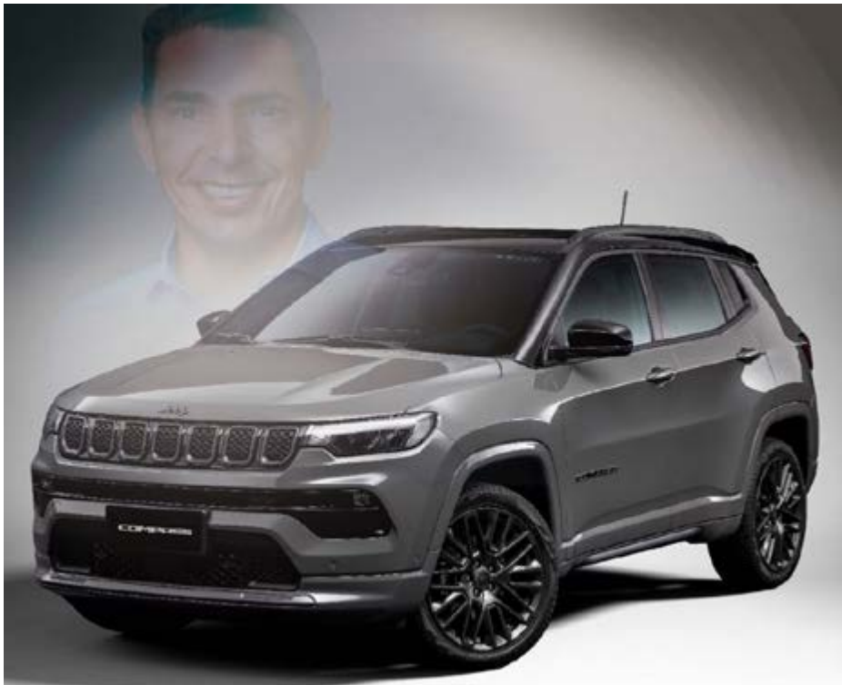
Jeep Compass, um dos veículos escolhido pela Prefeitura de Valinhos para locação com contrato de um ano