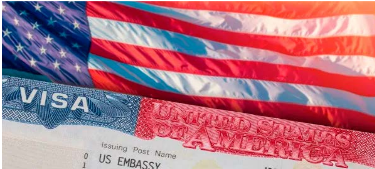
Bandeira dos Estados Unidos, que teve depois de muito tempo número maior de pessoas deixando o país do que chegando