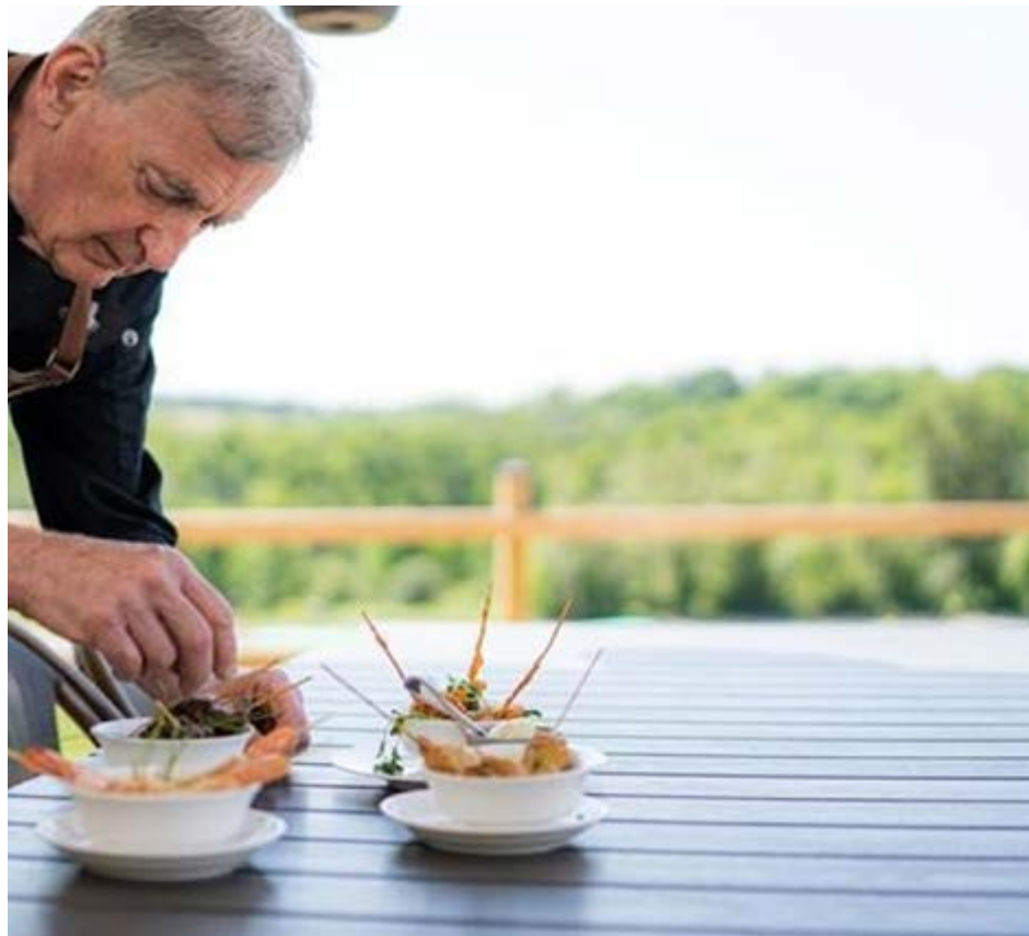
Chefe de cozinha com mais de 50 anos finaliza prato durante trabalho: faixa etária valorizada

Assim como terminou 2025, o aluguel residencial em Campinas e região inicia o ano em alta. Segundo o Índice FipeZAP, em janeiro o valor pedido pelos proprietários subiu 0,46%, acima do IGP-M (0,41%), utilizado para reajustar os contratos. Apesar disso, o índice de janeiro desacelerou na comparação com dezembro, quando foi de 1,35%. No acumulado de 12 meses, o aluguel residencial chega a 17,45%, ante 0,91% de alta do IGP-M.