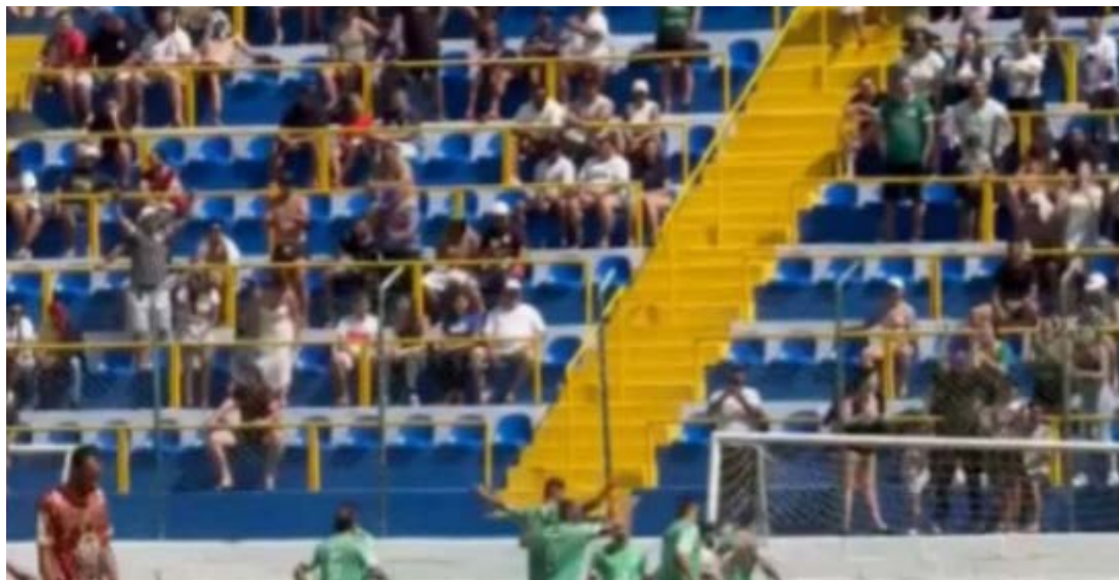
Arquibancada do Estádio Municipal Eugênio Francischini, no Bom Retiro, em Valinhos, que teve interdição determinada pela Justiça