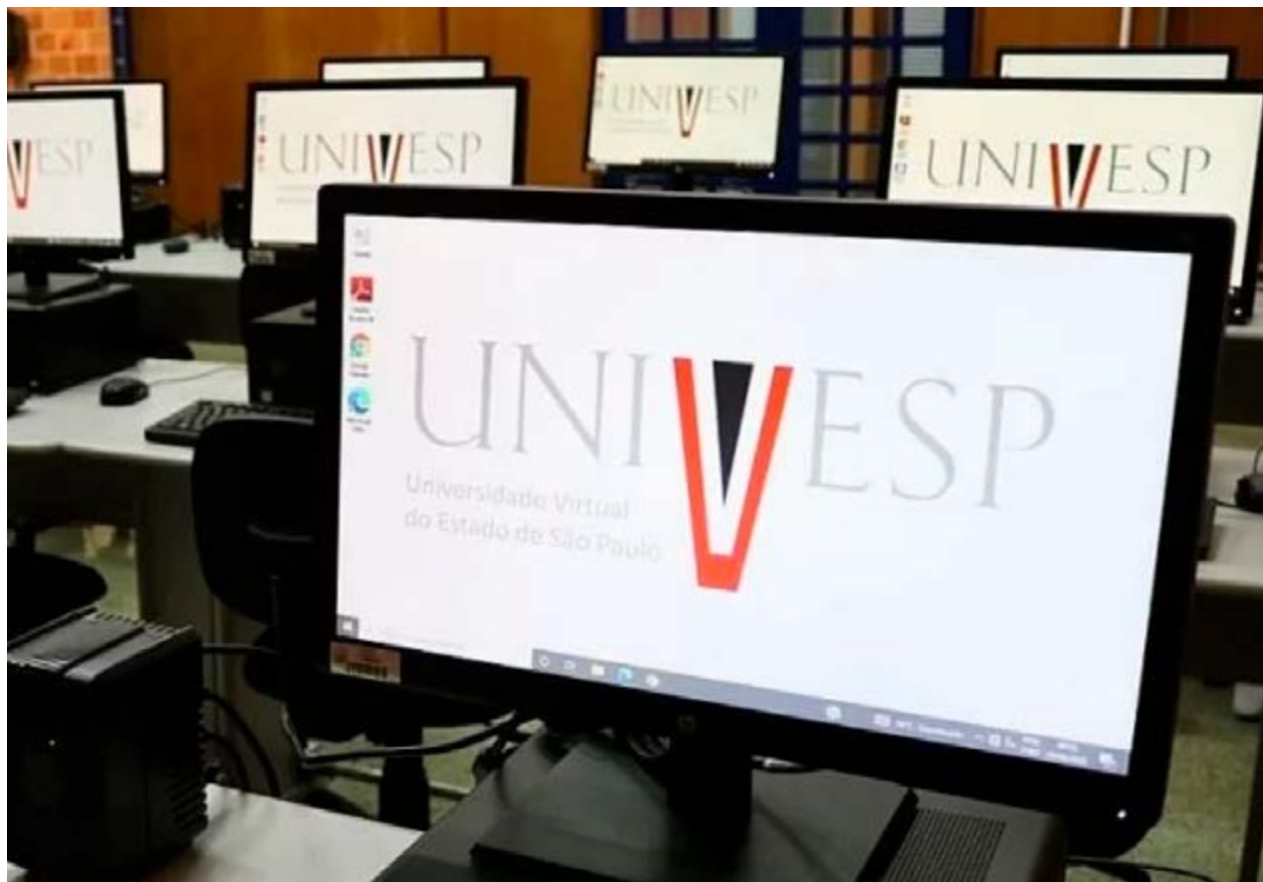
Computador em polo da Univesp: número de cursos e vagas na região de Campinas é atrativo para os estudantes