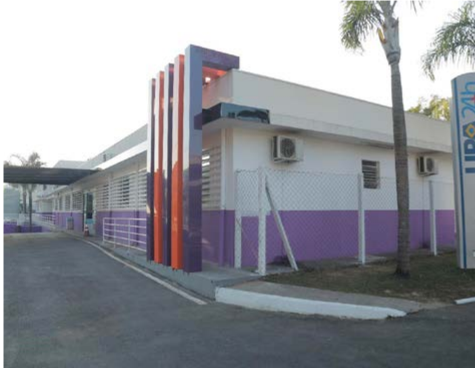
Fachada da UPA de Valinhos, que ficou totalmente às escuras na noite da última quinta-feira: nem o gerador funcionou

UBS Jardim Maracanã - Rua Prof. Maria de Camargo, 2