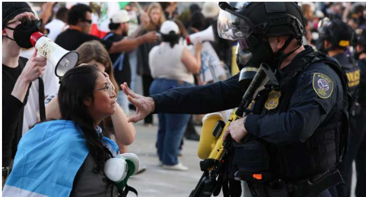
Agente de imigração dos Estados Unidos durante protesto contra as ações do governo do presidente Trump