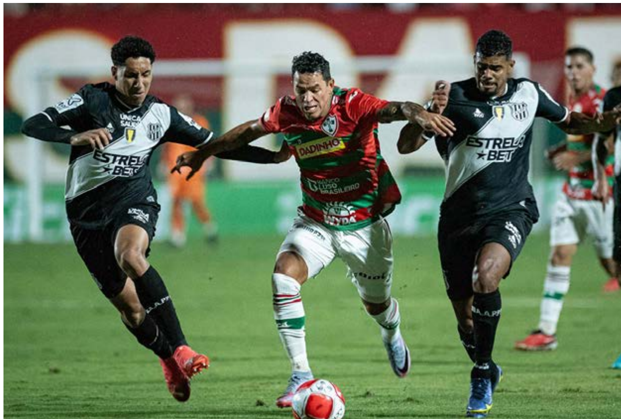
Lance de jogo entre Portuguesa e Ponte ano passado: duelo deste sábado pode selar rebaixamento da Macaca

Marrocos será o primeiro adversário da Seleção Brasileira na Copa do Mundo. O time de Carlo Ancelotti caiu no Grupo C e começará sua campanha em 13 de junho. Além dos marroquinos, o Brasil terá pela frente o Haiti e a Escócia na fase de grupos.