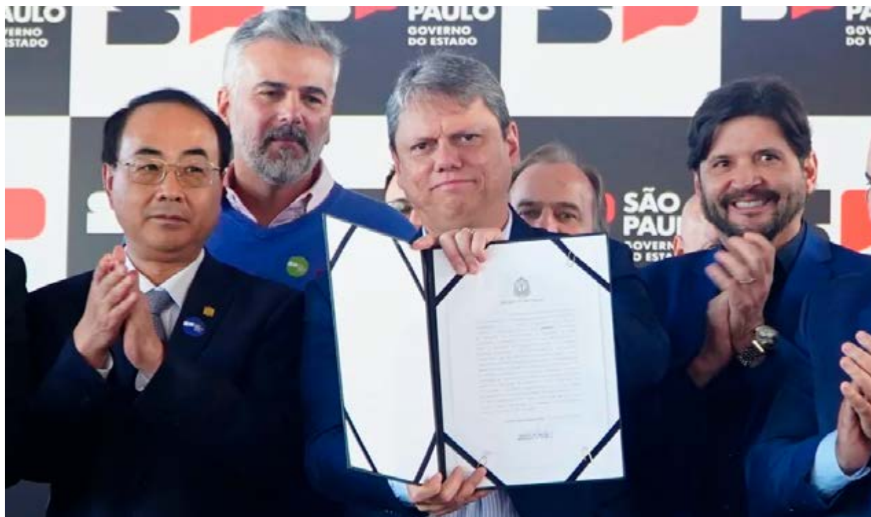
O governador Tarcísio de Freitas, no Palácio dos Bandeiras, durante a solenidade de anúncio do pacote que inclui as moradias da região