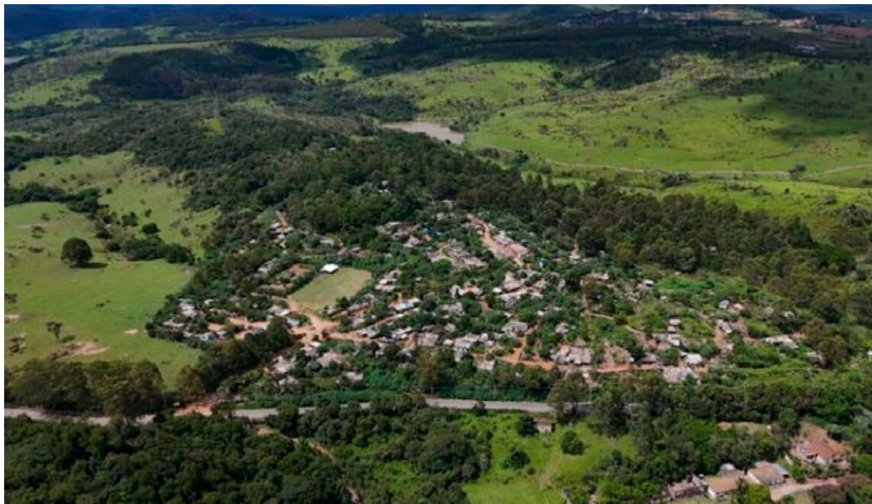
Vista aérea da área do acampamento Marielle Vive, em Valinhos: governo federal prepara compra da área e regularização