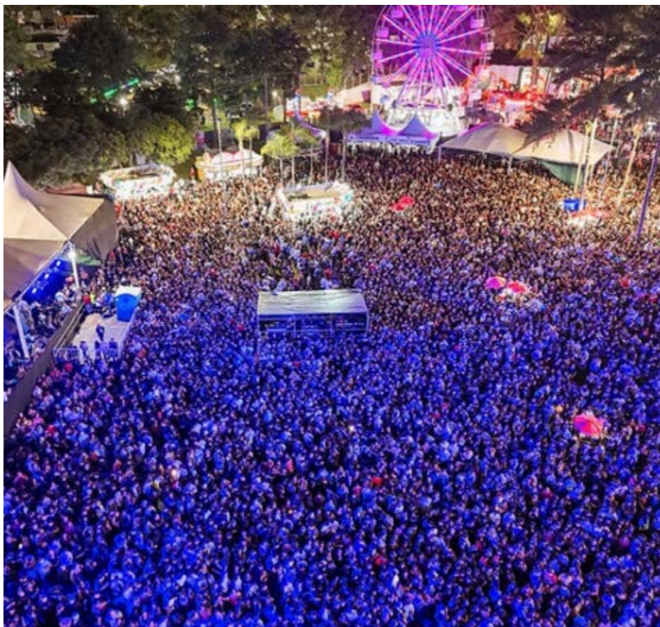
Vista da Festa do Figo de Valinhos, que teve grandes atrações: um dos eventos mais tradicionais do Interior do Estado