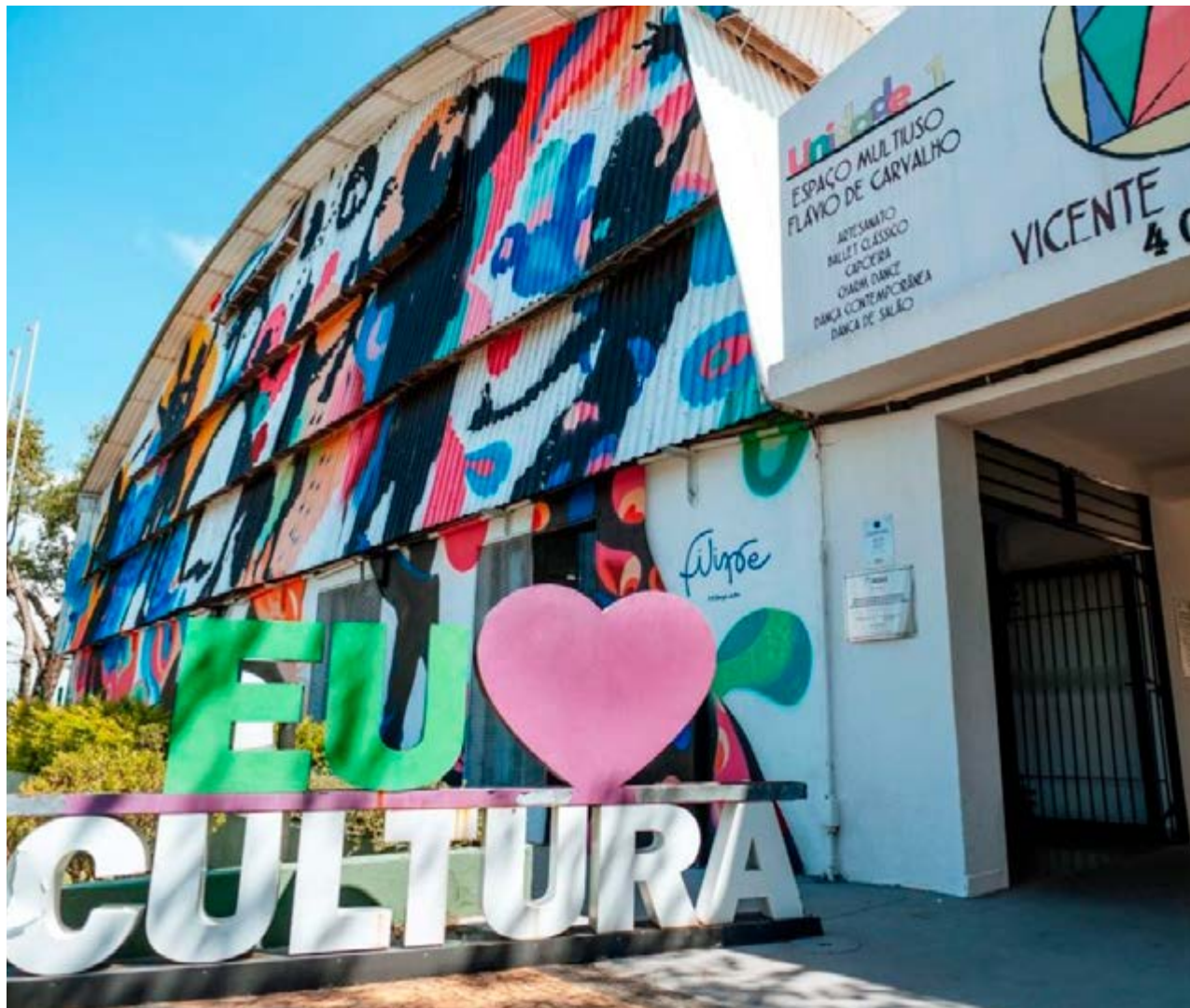
Fachada da Secretaria de Cultura de Valinhos, na Avenida Joaquim Alves Corrêa: chamamento vai até dia 20